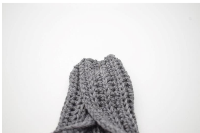
5. Fold den anden halvdel af højre del hen over venstre del.