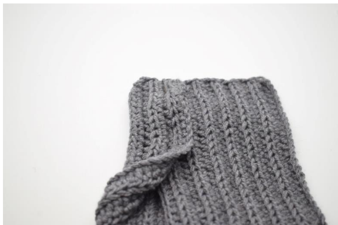
4. Fold den anden halvdel af venstre del som ikke overlappes hen over højre del.