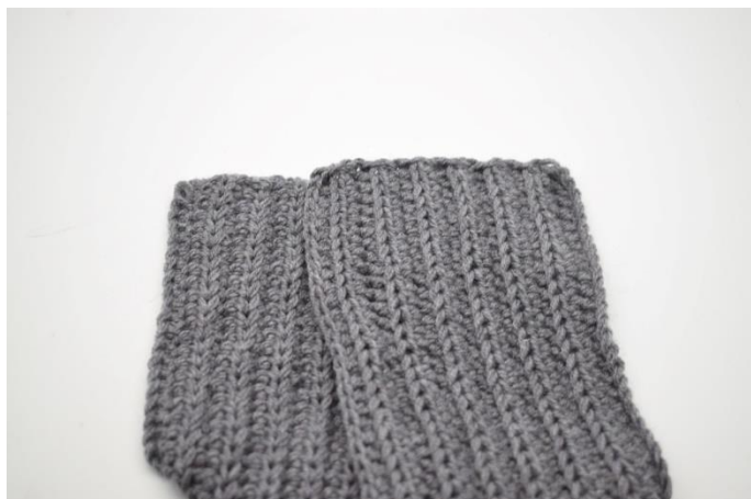
3. Læg højre del hen over venstre del så den overlapper det halve af venstre del.