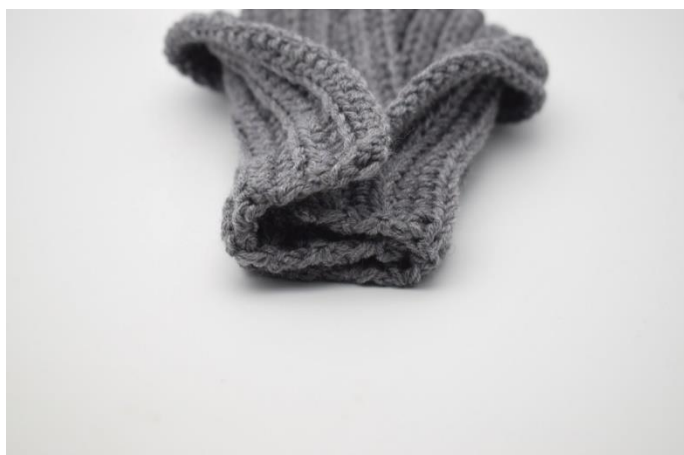
6. Ende stykkerne er nu foldet ind i hinanden som der ses på billedet her.