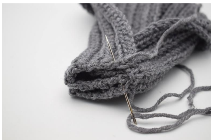
7. Sy igennem alle 4 lag ende stykkerne sammen.