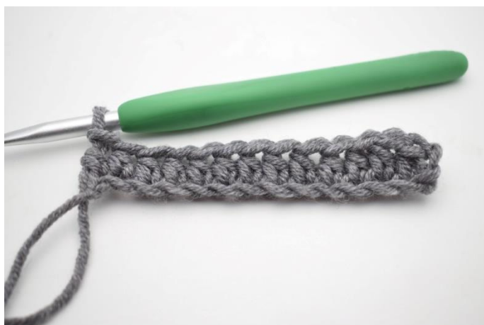
4. Hækl hstm rækken ud. = 68(72)76 m.