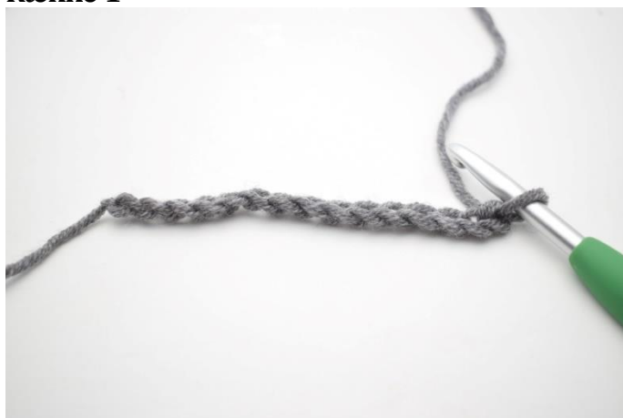
1. Slå 69(73)77 lm op.