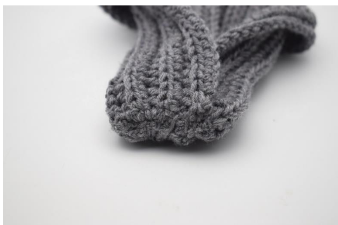
8. Sådan. Klip garnet og hæft ender.