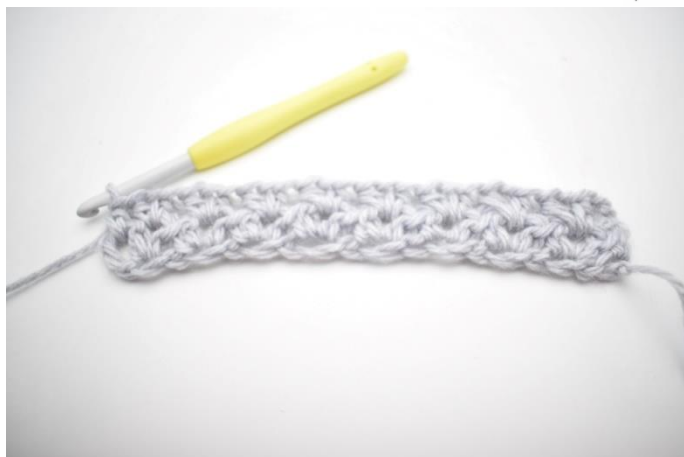
9. Det var række 2.