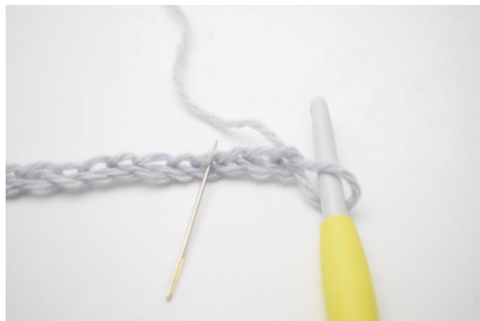
2. I 4.lm fra nålen hækles 1 hstm, 1 lm og 1 hstm. Nålen her markerer den lm der skal hækles i.