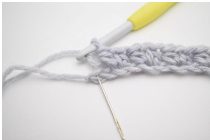
9. Spring 1 lm over og hæk 1 hstm i sidste m.