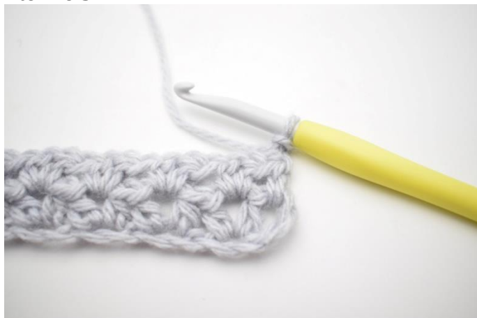
1. Række 3 hækles som række 2. Vend dit arbejde med 2 lm. (Erstatter 1 hstm)