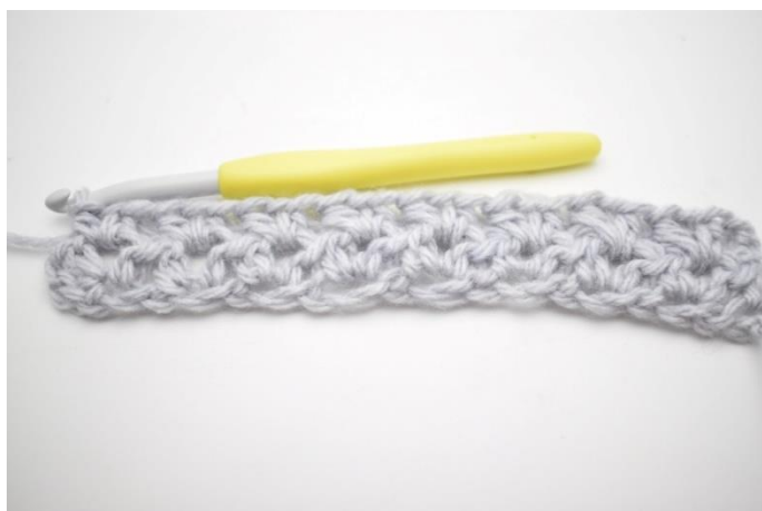
6. Gentag "til" rækken ud.