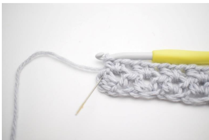
7. Hækl 1 hstm i sidste m.