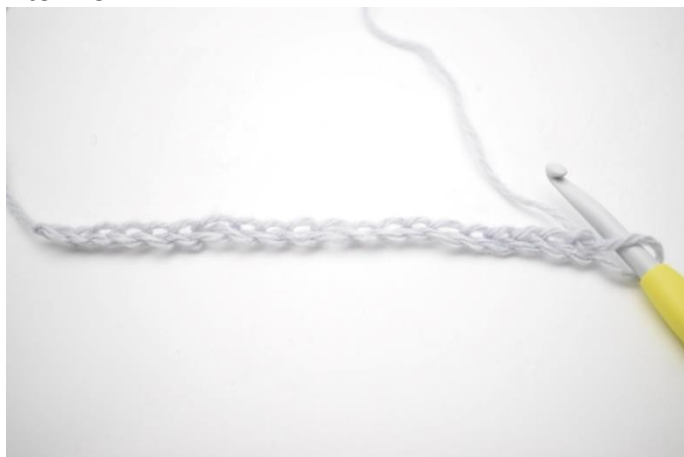
1. Slå din lm op.