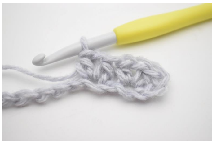
5. Hækl 1 hstm, 1 lm og 1 hstm i næste lm.