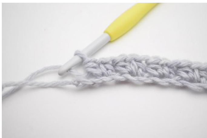
8. "Spring 1 lm over. Hækl 1 hstm, 1 lm og 1 hstm i næste lm". Gentag "til" rækken ud til du har 2 lm tilbage.