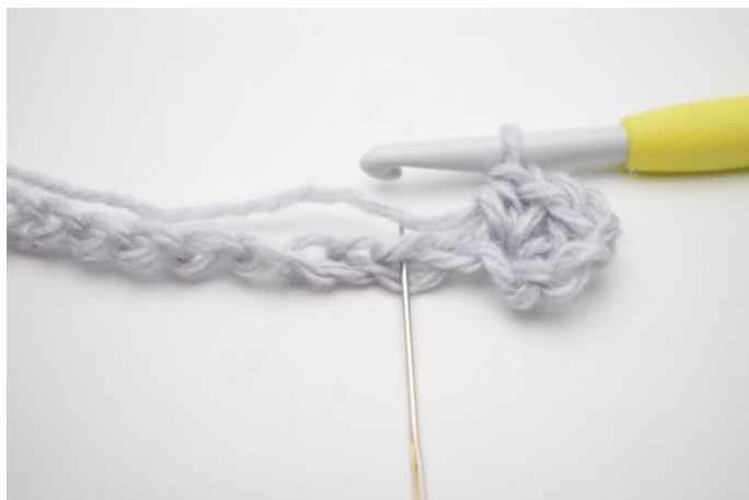
4. Spring 1 lm over.