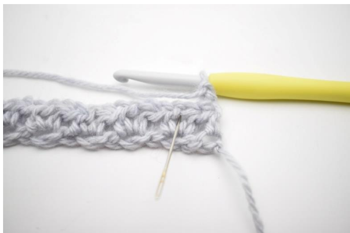
2. "Hæk 1 hstm, 1 lm og 1 hstm i lm-mellemrum fra forrige række". Nålen her markerer det lm-mellemrum der skal hækles i.