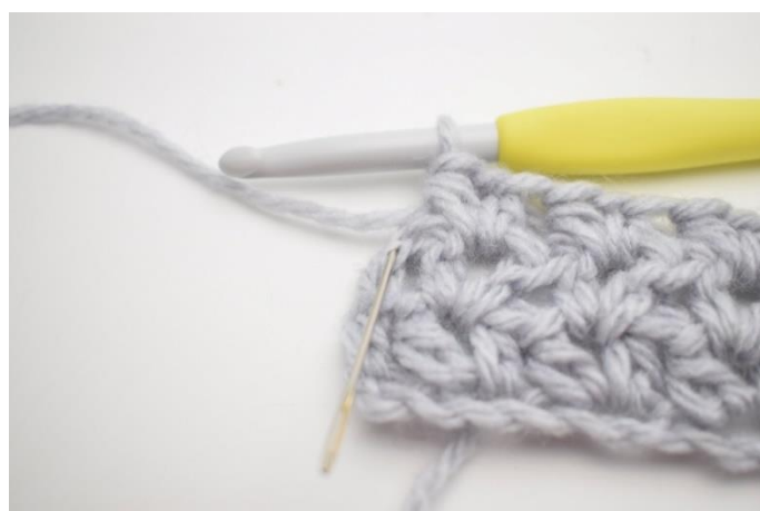
4. Hækl 1 hstm i sidste m.