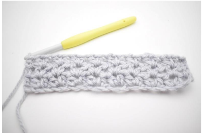
6. Det var række 3.