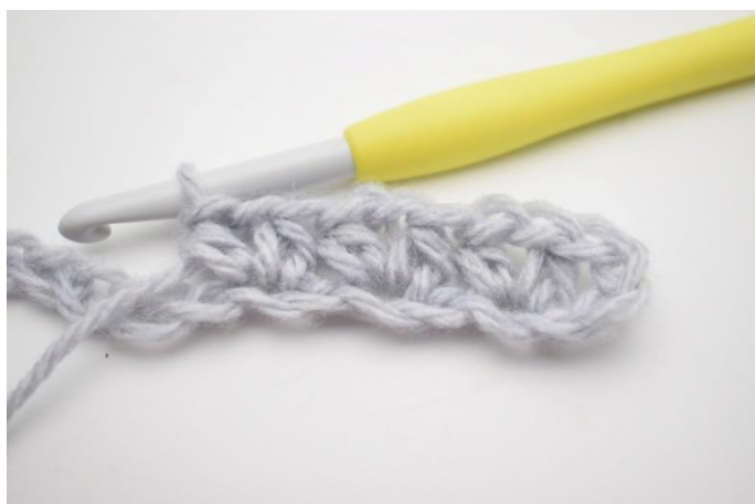
7. Hækl 1 hstm, 1 lm og 1 hstm i næste lm.