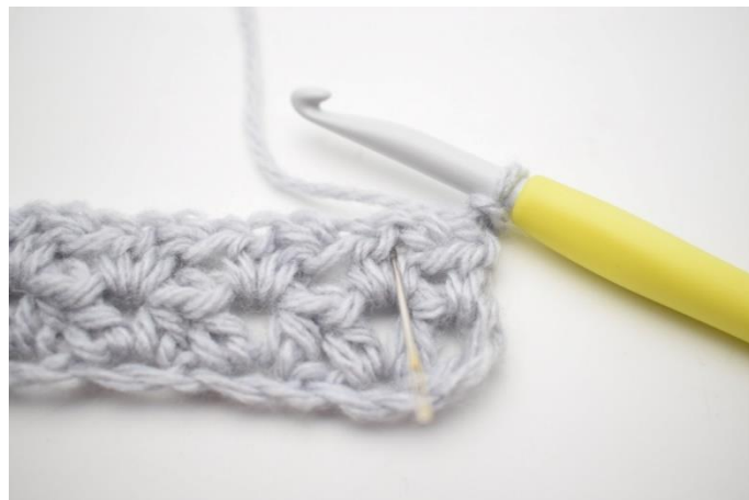
2. "Hækl 1 hstm, 1 lm og 1 hstm i første mellemrum fra forrige række". Nålen her markerer hvor der skal hækles.