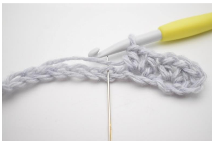
6. Spring 1 lm over.