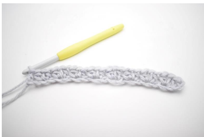
11. Det var første række.