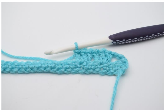
7. I næste maske hækles 1 stgm gruppe.