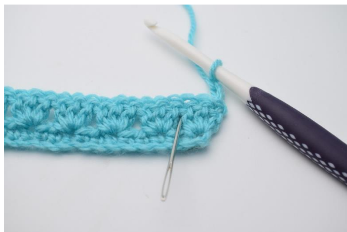
10. Nu hækles der i mellemrum mellem stgm grupperne på forrige række.