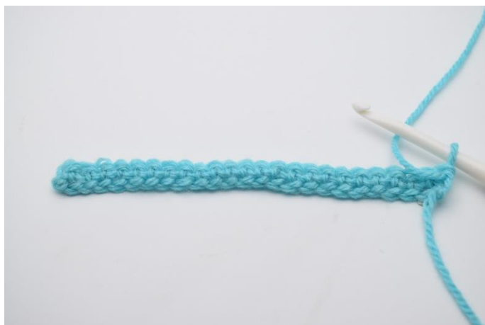
2. I 2. lm fra nålen hækles 1 fm. Hækl nu fm rækken ud.