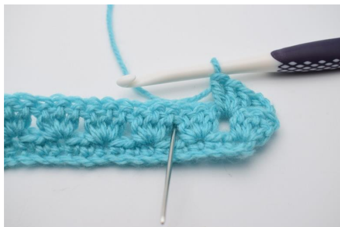
12. Næste stgm gruppe hækles i næste mellemrum mellem stgm grupperne på forrige række.