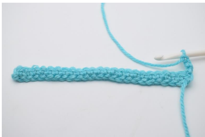
3. Vend arbejdet og lav 3 lm.