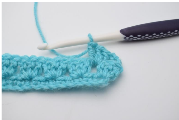
11. Hækl 1 stgm gruppe i første mellemrum.