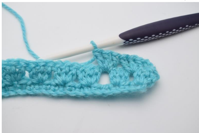
13. Hækl 1 stgm gruppe.