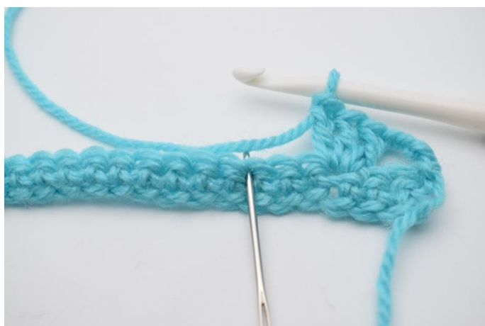
6. Spring 2 masker over.