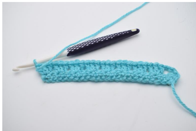
8. Gentag rækken ud. Rækken afsluttes med 1 stgm gruppe.