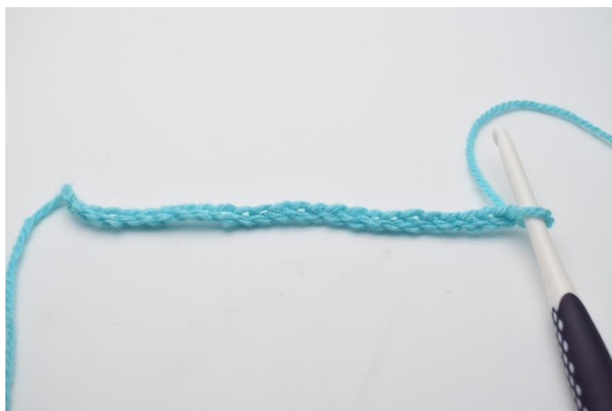
1. Start med at slå dine luftmasker op.

Guiden er lavet med mindre masker, men fremgangsmåden er den samme.