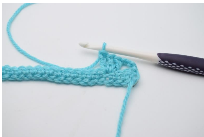
5. I næste maske hækles 1 stgm gruppe.