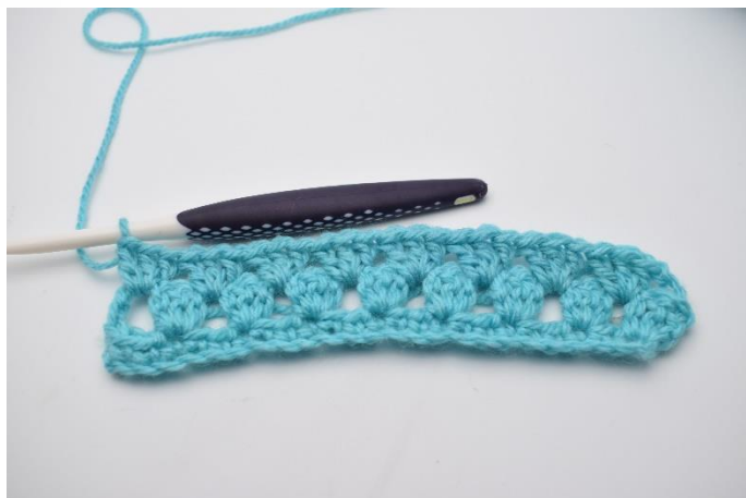
14. Sådan gentages rækken ud. Afslut rækken med 1 stgm gruppe i mellem sidste stgm gruppe og de 3 lm på forrige række.