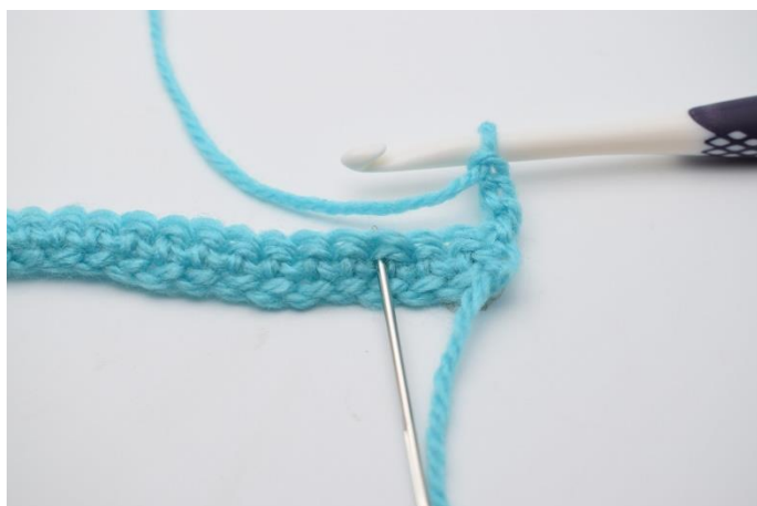
4. Spring 2 masker over.