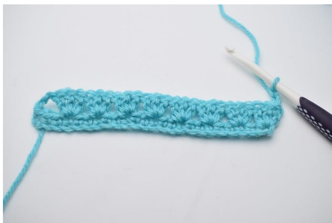
9. Vend dit arbejde, og lav 3 lm.