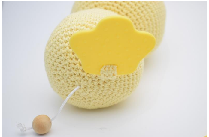
4. og sy den fast under anden.