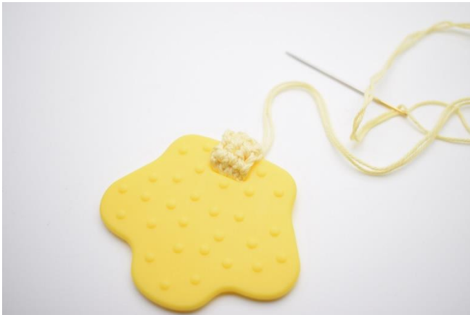
3. Sy stykket sammen,