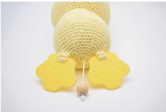
5. Gentag dette ved begge fødder.