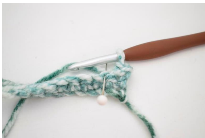
10. Hækl 1 fm i næste m i bml.