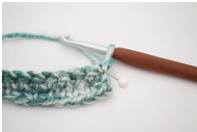
14. Hækl 1 fm i første m i bml.