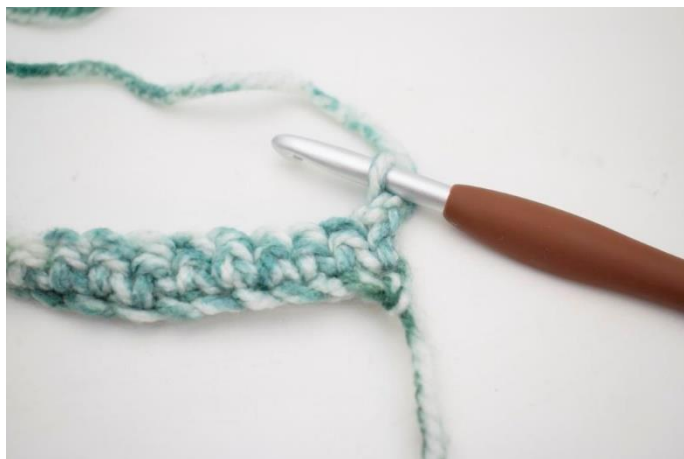
7. Vend med 1 lm.