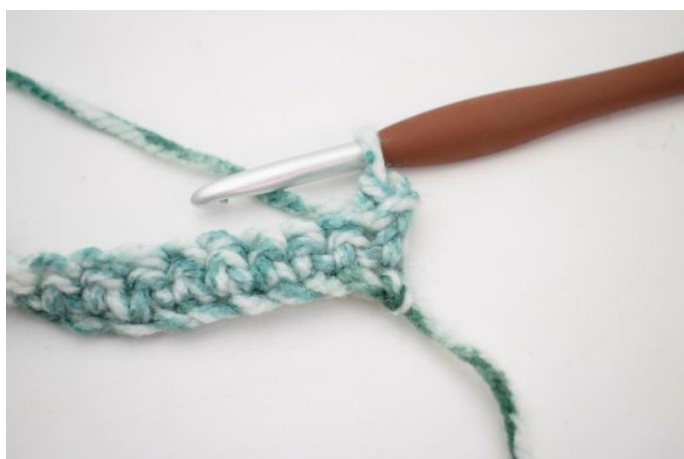
9. Sådan. Der er nu hæklet 1 fm i bml.