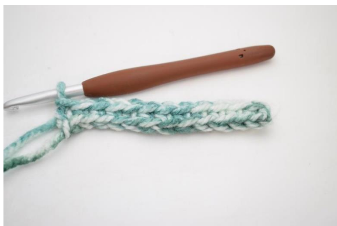
6. Hækl fm rækken ud. (43)