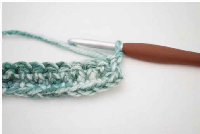
13. Denne række hækles som række 2. Vend med 1 lm.