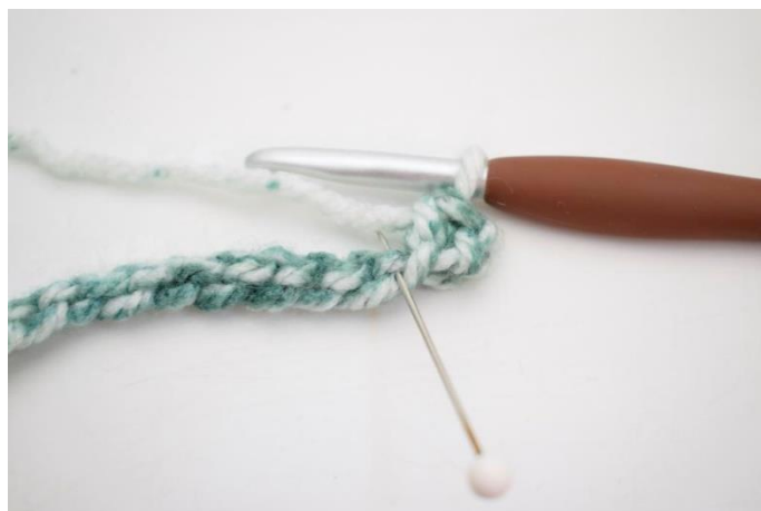
4. Hækl 1 fm i næste lænke.