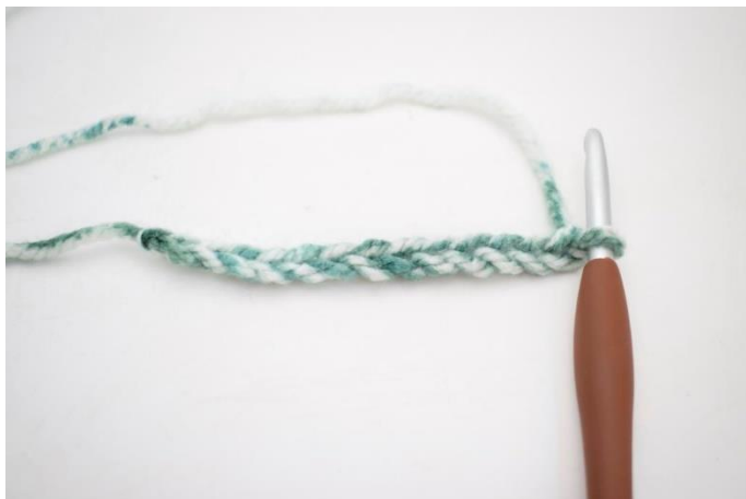
1. Slå 44 lm op.