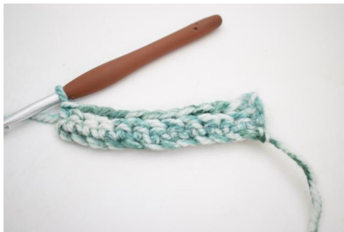
12. Hækl 1 fm i bml rækken ud. (43)