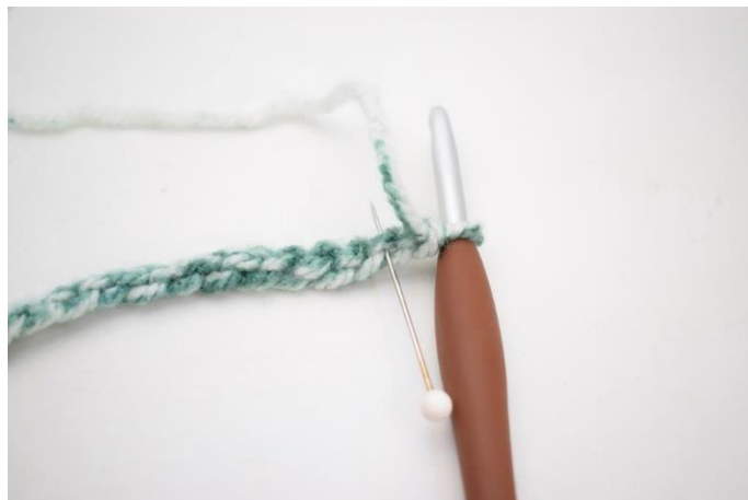
2. Drej din lm-række så "bagsiden" vender opad. Der hækles nu i de lodrette lænker. Hækl 1 fm i 2. lm fra nålen.