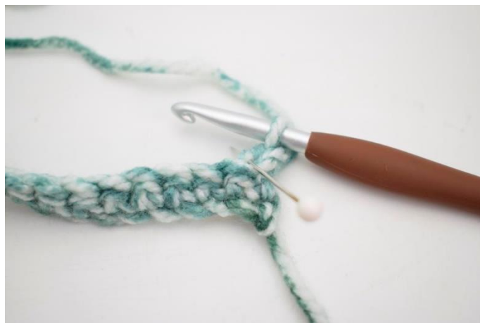
8. Hækl 1 fm i bml rækken ud. Den bagerste lænke er den lænke nålen her viser.