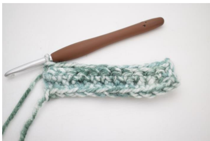
16. Hækl 1 fm i bml rækken ud. (43)