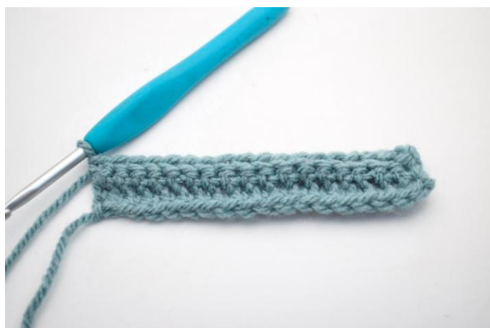
16. Hækl 1 fm i bml rækken ud. (44)