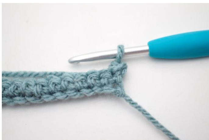
9. Sådan. Der er nu hæklet 1 fm i bml.