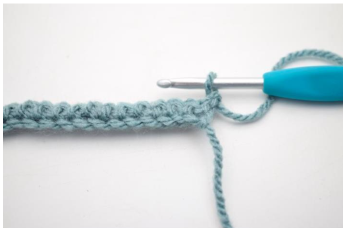
7. Vend med 1 lm.