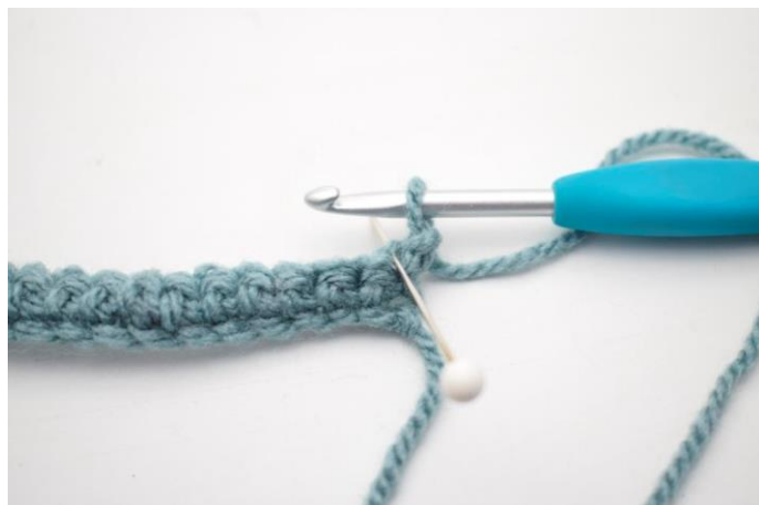
8. Hækl 1 fm i bml rækken ud. Den bagerste lænke er den lænke nålen her viser.