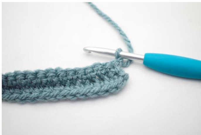
13. Denne række hækles som række 2. Vend med 1 lm.