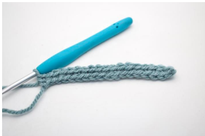
6. Hækl fm rækken ud. (44)