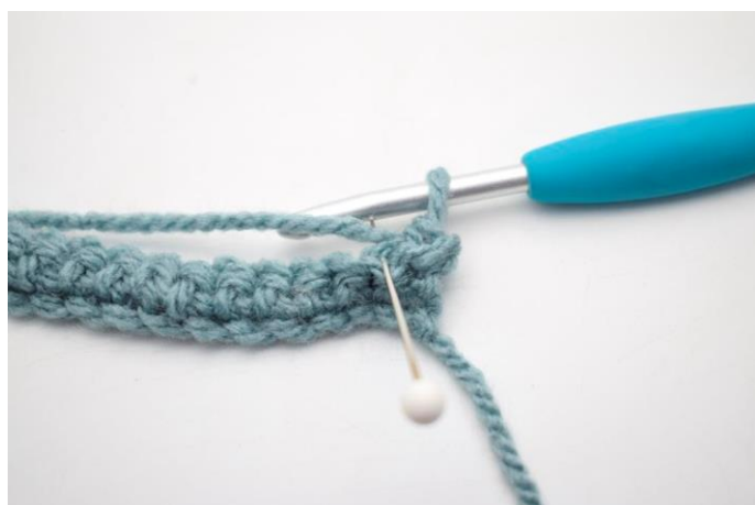
10. Hækl 1 fm i næste m i bml.