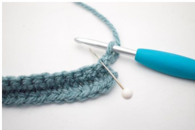
14. Hækl 1 fm i første m i bml.