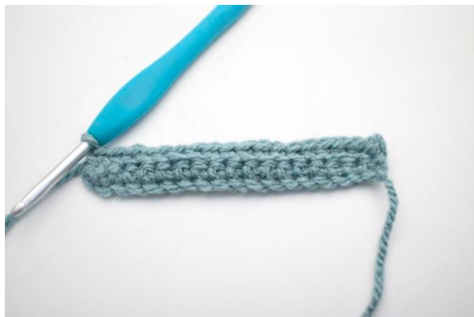
12. Hækl 1 fm i bml rækken ud. (44)