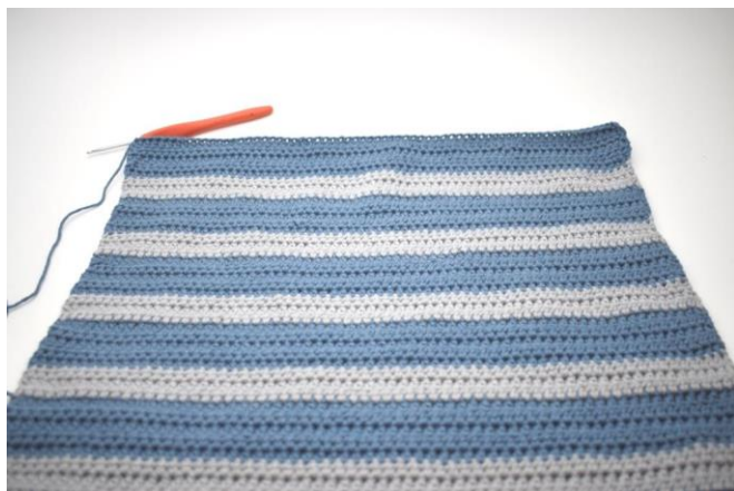
Vend med 1 lm.