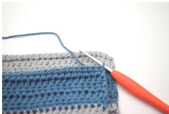
Hækl de 2 korte sider sammen med km.