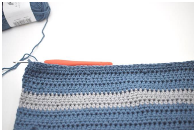
Gentag rækken ud.