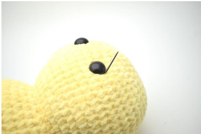
1. Med sart gul trækkes nålen ud i siden på det ene øje.

Lav evt. fordybninger ved øjnene på følgende måde: