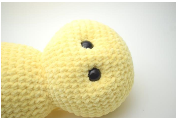
5. Træk lidt til så øjnene trækkes lidt ind og der dannes fordybninger.