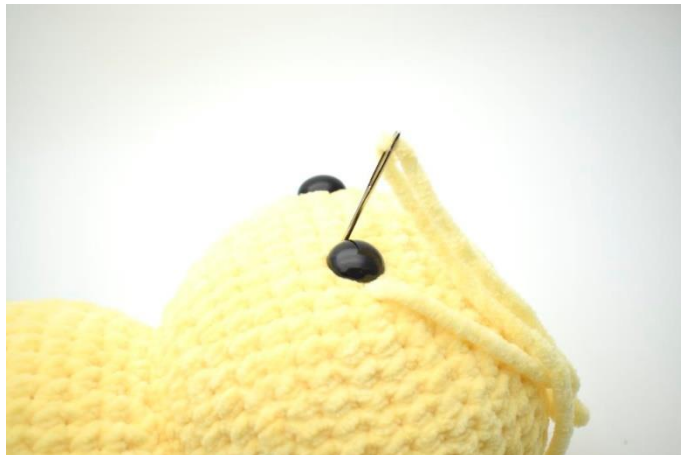
2. Stik nålen ned i den anden side af øjet og træk lidt til.