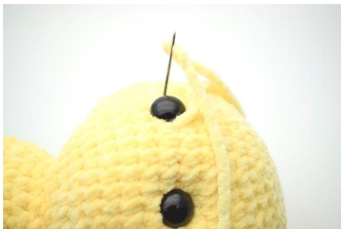
4. og ned igen i den anden side af øjet.