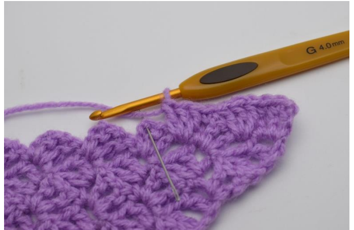
8. Spring 2 stgm over og hæk 1 fm i lm-buen.