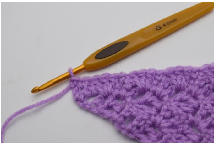
11. Afslut med fm i de sidste stgm. Klip og hæft enden.