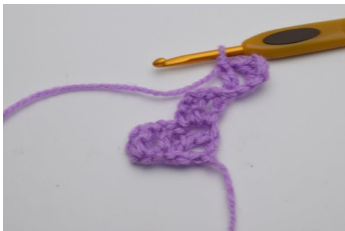
3. Lav 1 lm, og hækl 1 stgm i den sidste lm.