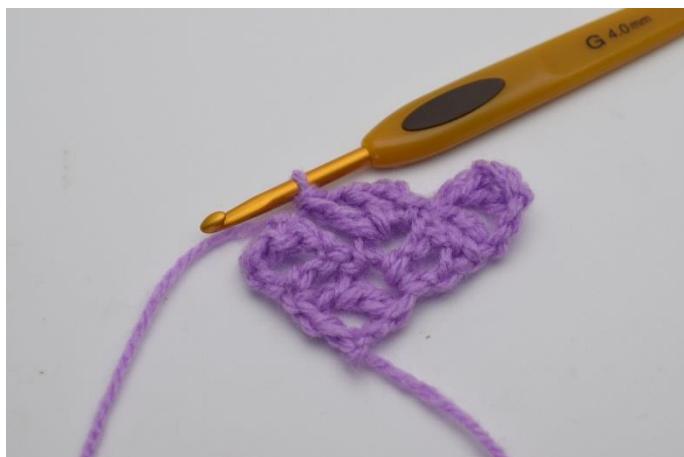
6. Hækl "1 stgm, 1 lm og 1 stgm" ned i den lmbue du netop har lavet 1 km i.