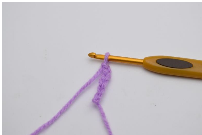
1. Start med at slå 6 lm op.