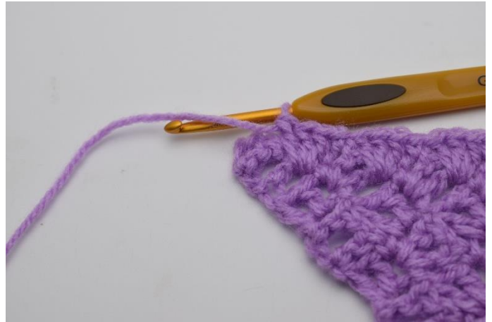
10. Gentag rækken ud.