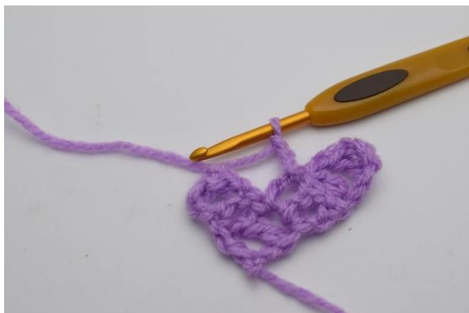
5. Lav 3 lm.