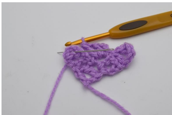
7. Lav nu 1 km i firkanten under. Nålen her viser hvor din km skal hækles.