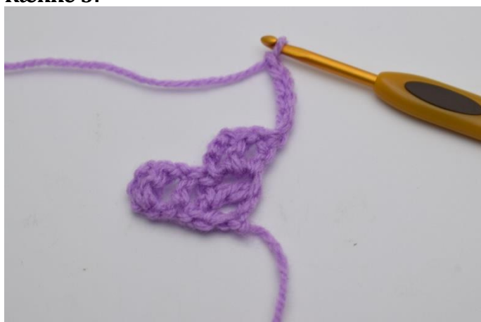
1. Vend arbejdet og lav 6 lm.