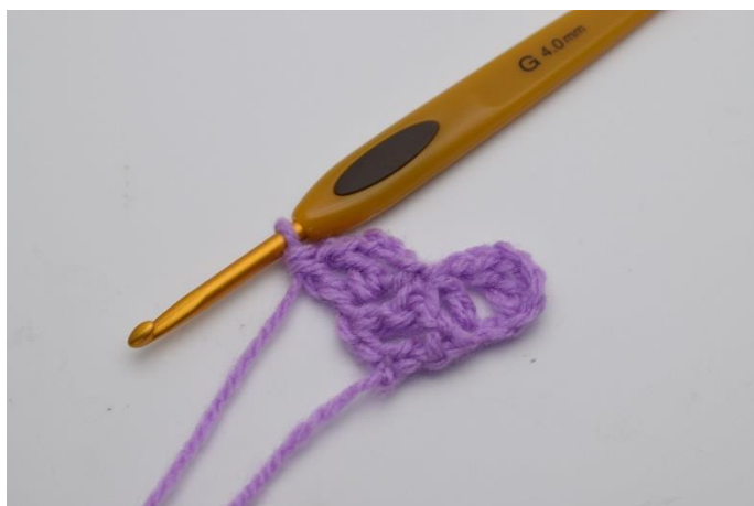
8. Der er nu dannet endnu en "firkant". Og række 2 har nu 2 "firkanter".