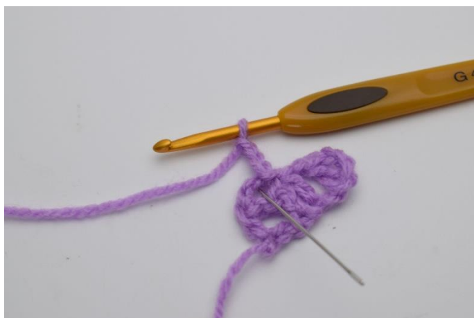
7. Hækl "1 stgm, 1 lm og 1 stgm" ned i den lmbue du netop har lavet 1 km i.