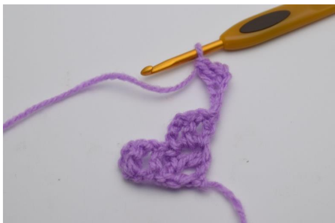
2. Hækl 1 stgm i 4. lm fra nålen.