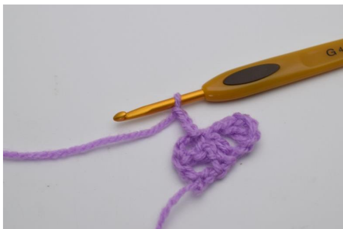
6. Lav 3 lm.