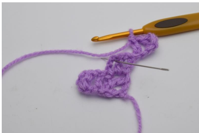
4. Lav nu 1 km i firkanten under. Nålen her viser hvor din km skal hækles.