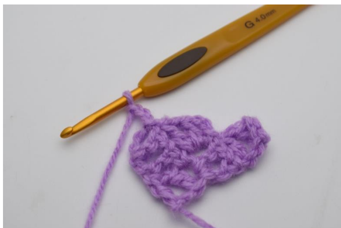
8. Lav 3 lm.