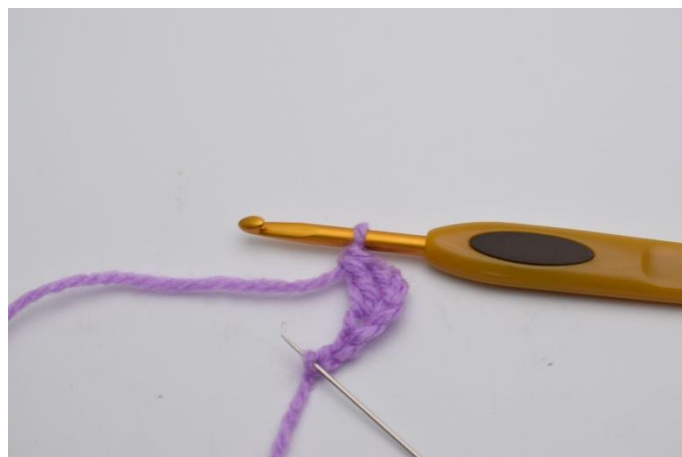
4. Lav 1 lm, spring 1 lm over og hæk 1 stgm i den sidste lm.