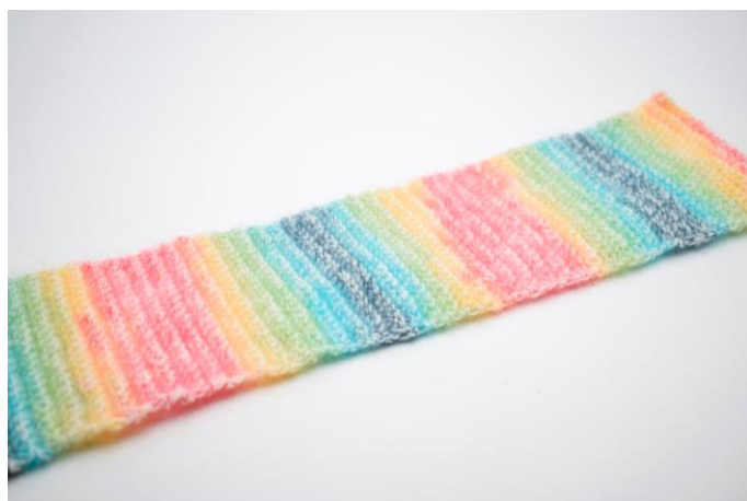
14. Klip garnet og hæft ender.