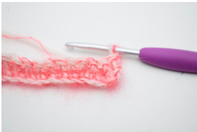
9. Denne række hækles som række 2. Vend med 1 lm.