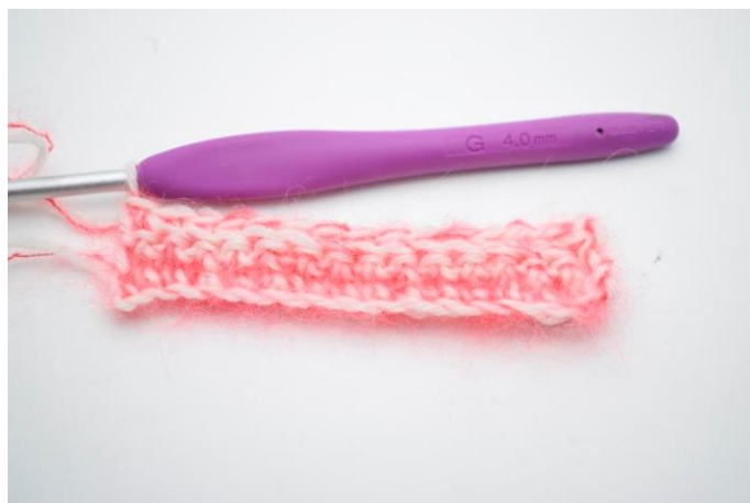
12. Vend med 1 lm. Hækl fm i bml rækken ud. (23)