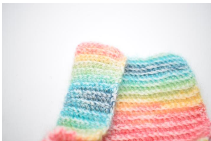
3. Fold den anden halvdel af venstre del som ikke overlappes hen over højre del.