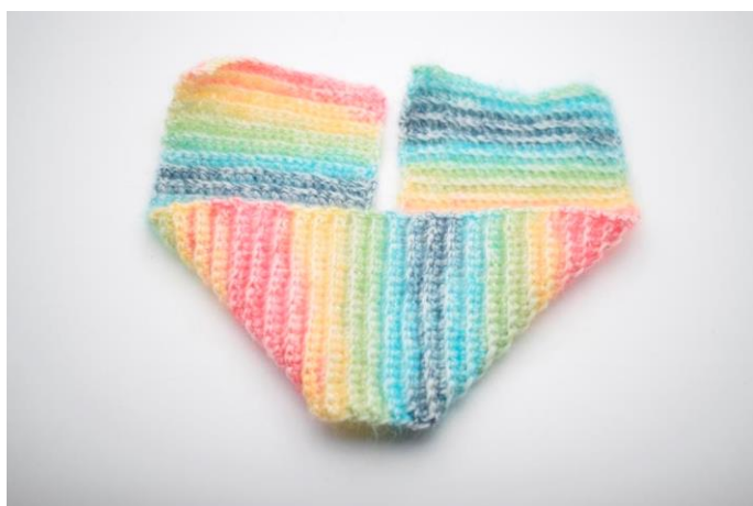
1. Læg stykket som på billedet her.