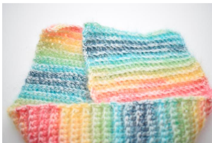
2. Læg højre del hen over venstre del så den overlapper det halve af venstre del.