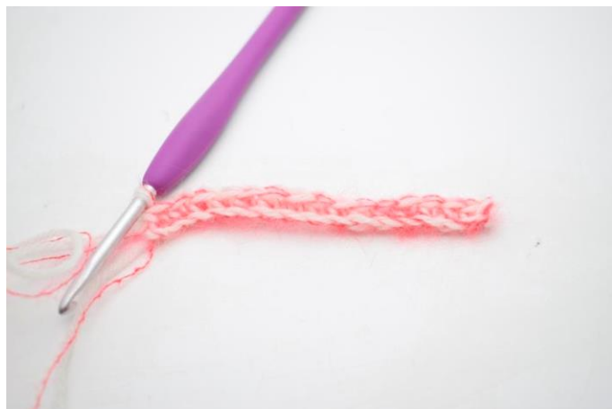
4. Hækl fm rækken ud. (23)