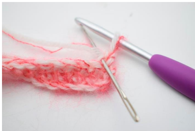
10. Hækl 1 fm i bml i første m.