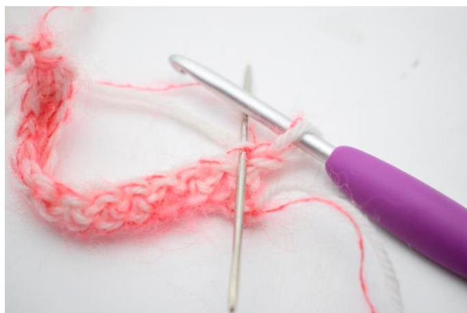
6. Hækl 1 fm i bml i første m. Nålen her viser den lænke din fm skal hækles i.