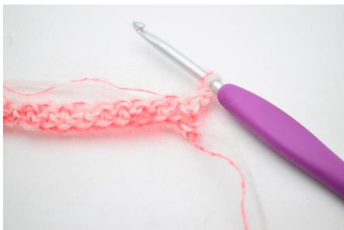
5. Vend med 1 lm.