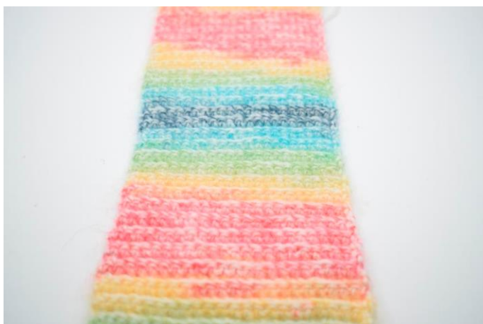
13. Gentag fremgangsmåden som række 2 til du har i alt 85 (90) 95 rækker.