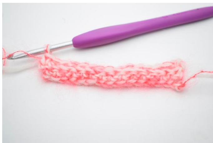
8. Hækl fm i bml rækken ud. (23)