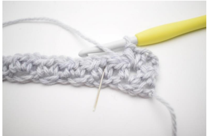
4. "Hækl 1 hstm, 1 lm og 1 hstm i næste mellemrum."