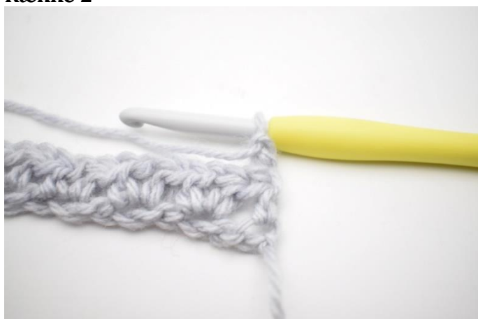
1. Vend dit arbejde med 2 lm.