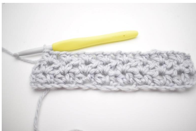
3. Gentag "til" rækken ud.