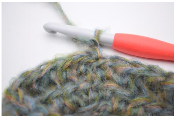
8. Vend arbejdet.