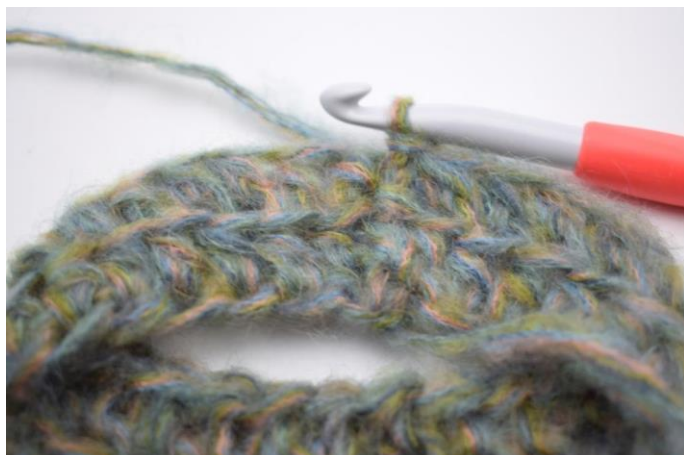
6. Hækl hstm i bml omgangen rundt. Afslut med 1 km i første hstm. (58)