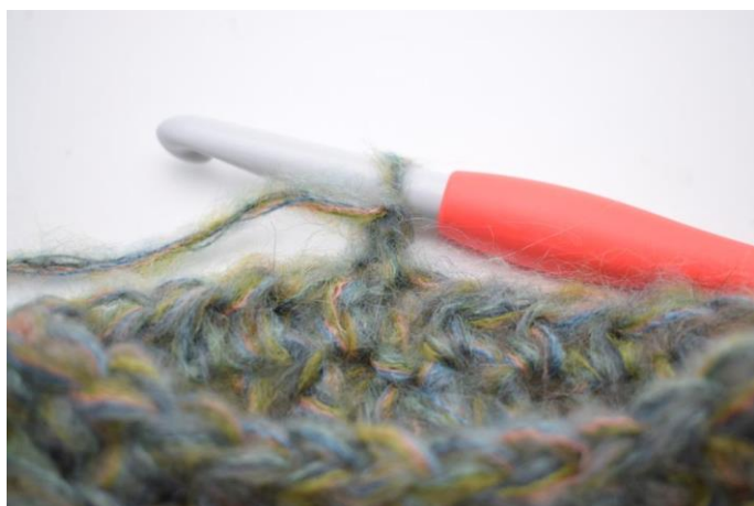
13. Vend arbejdet.