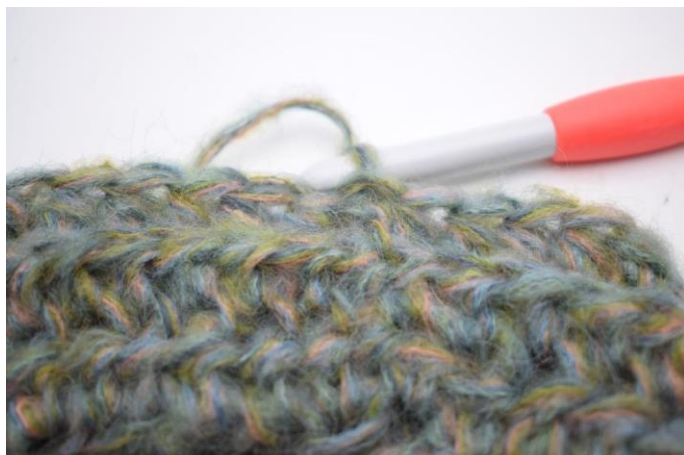
11. Hækl hstm i bml omgangen rundt. Afslut med 1 km i første hstm. (58)