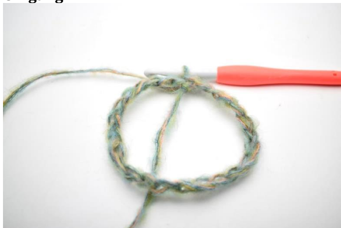
1. Slå 58 lm op. Saml din lm-række med 1 km.