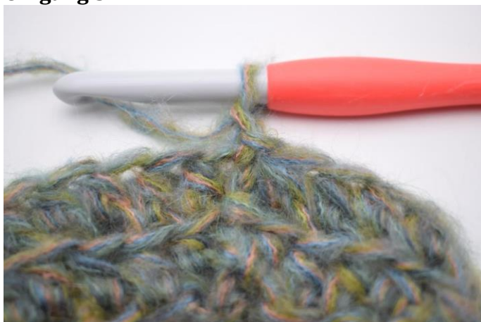
7. Lav 1 lm.