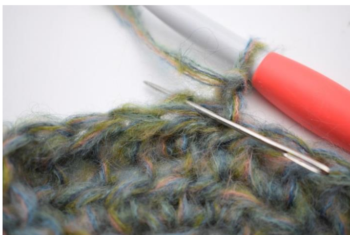
9. Hækl hstm i bml i første m.