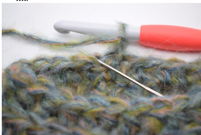
14. Hækl hstm i bml i første m.