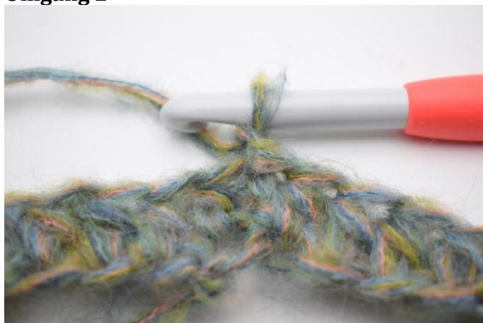
3. Lav 1 lm.