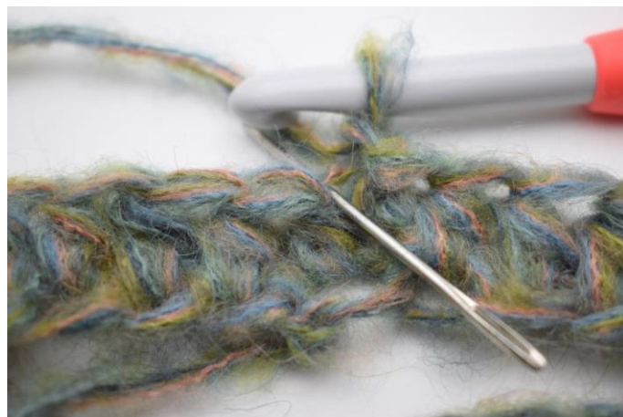
4. Hækl hstm i bml i første m. Nålen her viser den lænke din hstm skal hækles i.