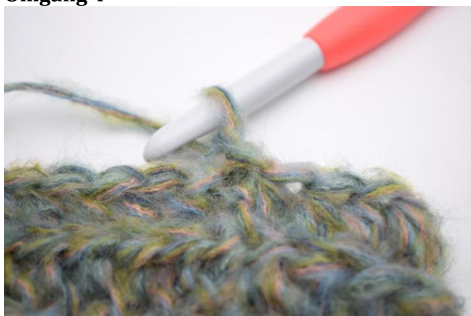
12. Denne omgang hækles som omgang 3. Lav 1 lm.