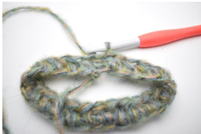
2. Lav 1 lm. Hækl hstm rundt i alle lm. Afslut med 1 km i første hstm. (58)