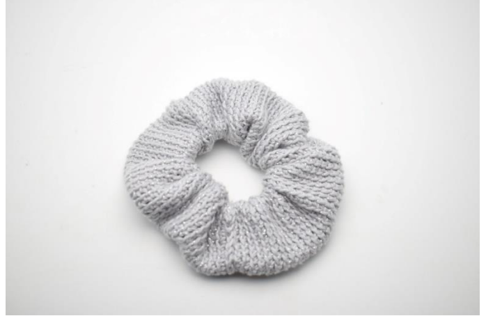
16. Klip garnet og hæft ender.