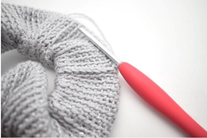
15. Gentag omgangen rundt.