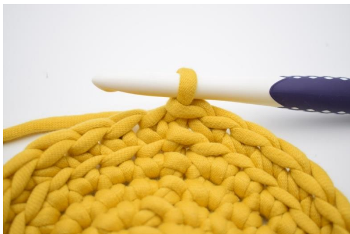
7. Gentag omgangen rundt og afslut med 1 km.