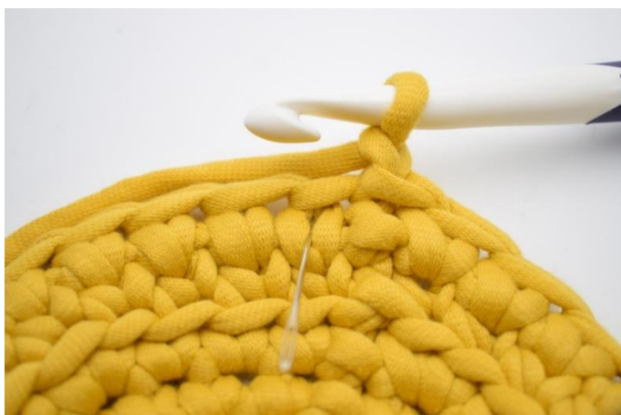
15. Hækl 1 ks i første "v".