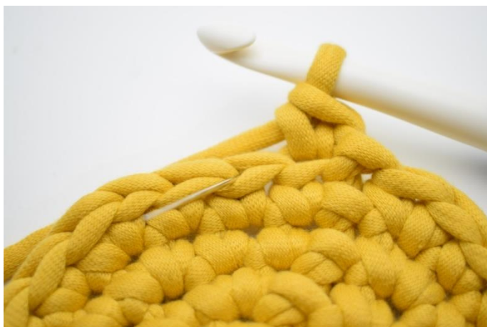
5. Hækl 1 fm i bml i næste m. Nålen her markerer den lænke din fm skal hækles i.