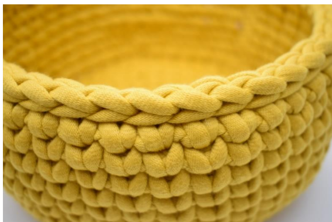
18. Gentag denne fremgangsmåde som beskrevet i opskriften. Afslut med 1 omgang km. Klip garnet og hæft ender.