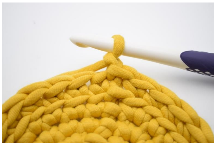
8. Lav 1 lm.