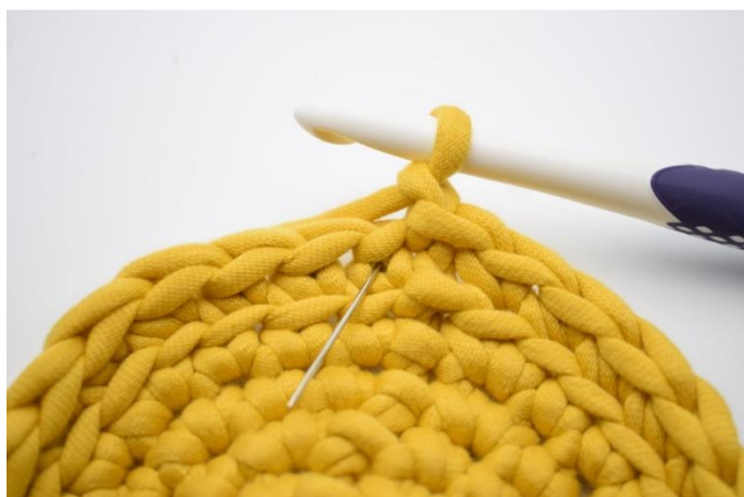
9. Denne omgang hækles med ks. Ks er en alm. Fm men som hækles i "v"et i stedet for som normalt i masken. Nålen her markerer det "V" din ks skal hækles i.