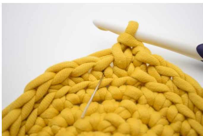
11. Hækl 1 ks i næste "v". Nålen her markerer hvor din ks skal hækles.