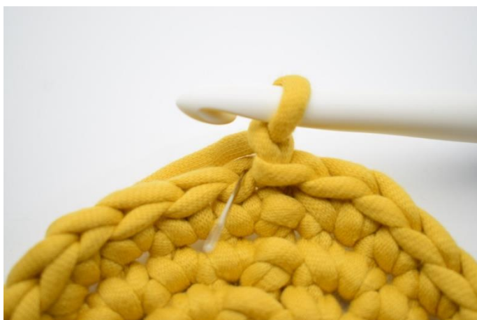
3. Denne omgang hækles der fm i bml. Nålen her markerer den lænke din første fm skal hækles i.