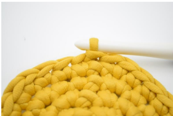
1. Her din bund netop afsluttet.