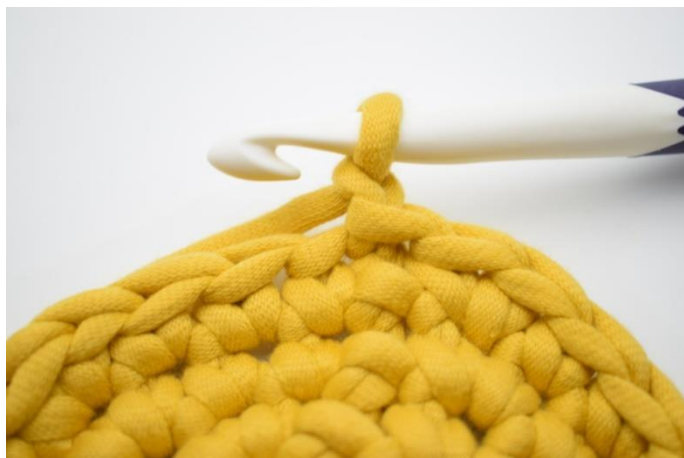
2. Lav 1 lm.