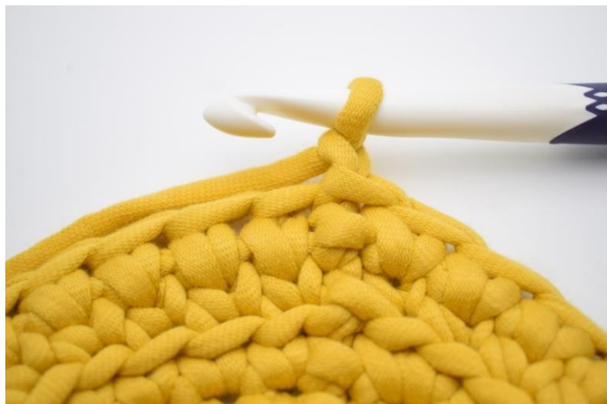
14. Sådan gentages omgangene. Lav 1 lm.