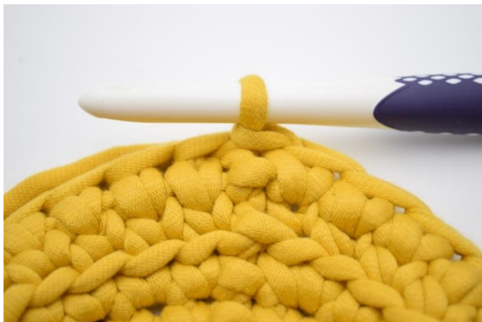
13. Gentag omgangen rundt og afslut med 1 km.