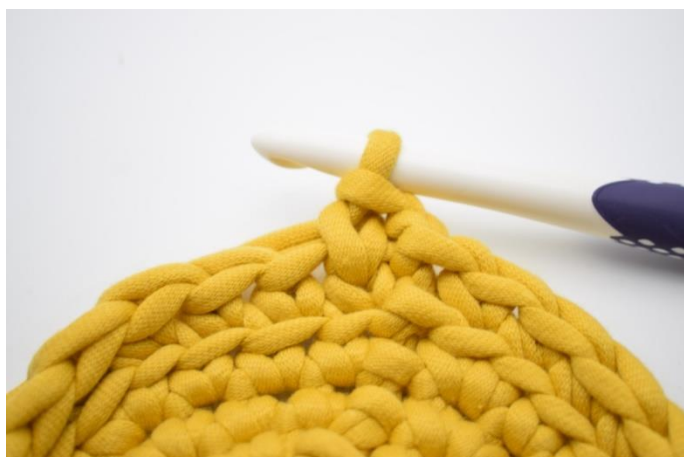
10. Sådan. Der er nu hækles en ks.