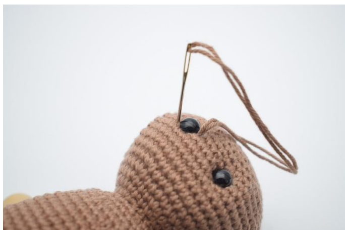
4. og ned igen i den anden side af øjet.