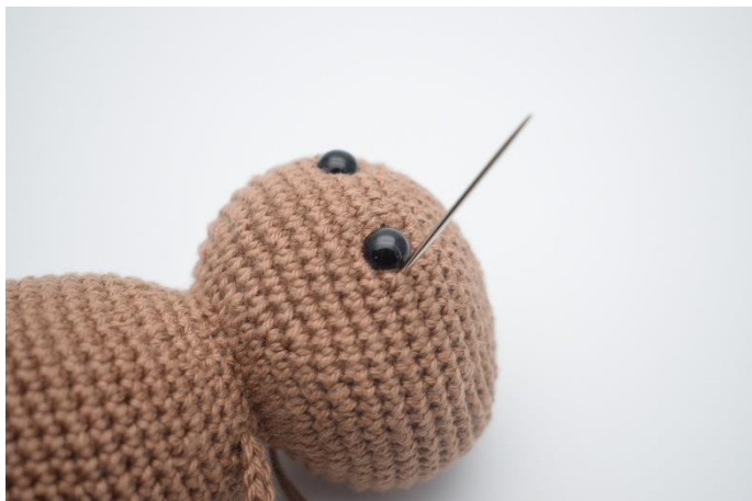
1. Med brunt garn trækkes nålen ud i siden på det ene øje.

Lav evt. fordybninger ved øjnene på følgende måde: