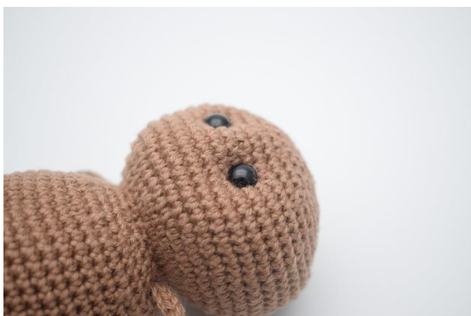
5. Træk lidt til så øjnene trækkes lidt ind og der dannes fordybninger.