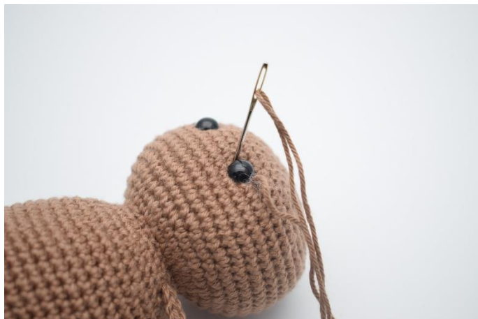
2. Stik nålen ned i den anden side af øjet og træk lidt til.