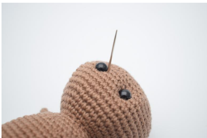
3. Stik nålen ud ved siden af det andet øje.