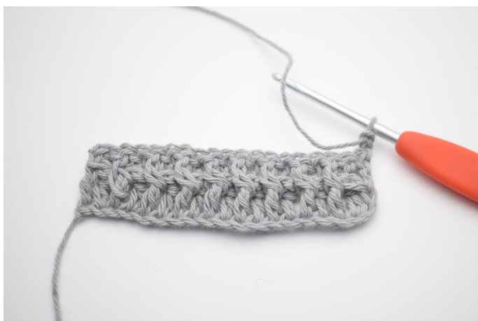
1. Vend med 2 lm.