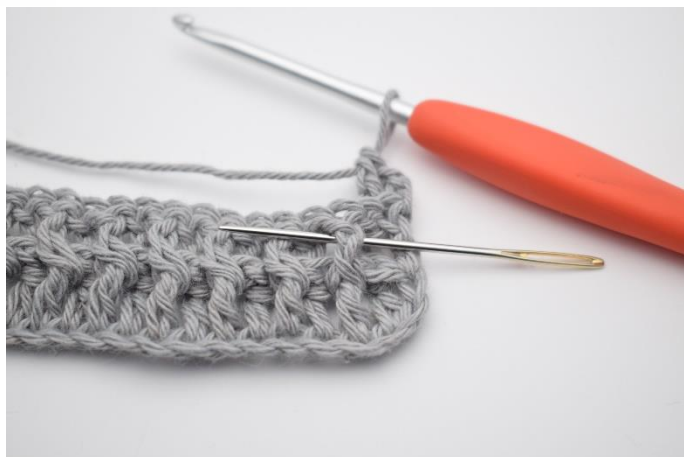
4. Hækl 1 Frstgm omkring næste stgm-stolpe.