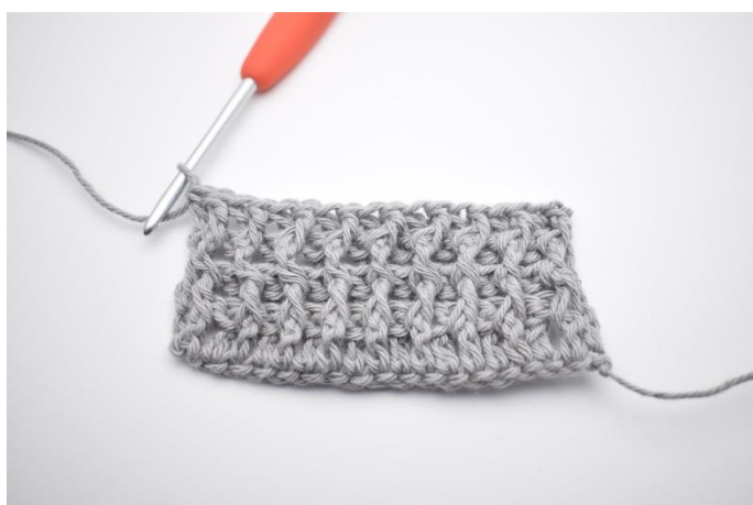
1. Række 4 hækles efter fremgangsmåden som række 2.