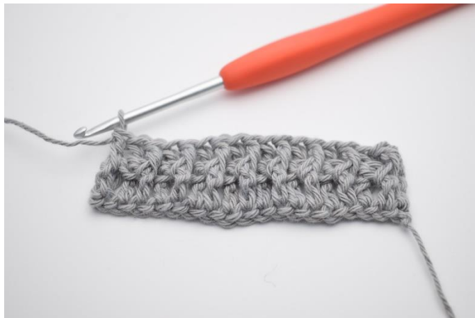
10. Gentag skiftevis rækken ud.