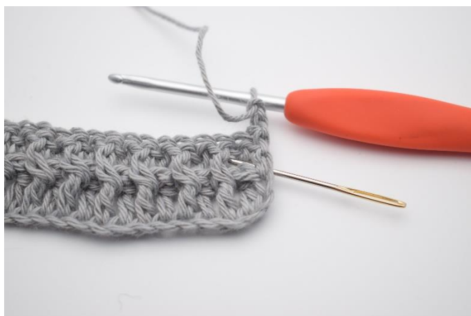
2. Hækl 1 Brstgm omkring første stgm-stolpe.