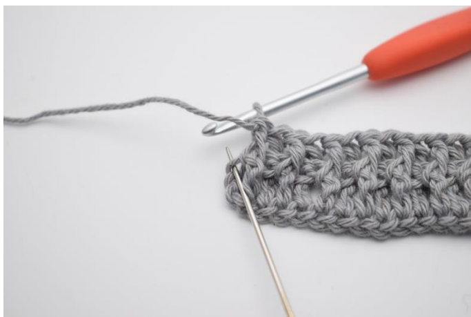
11. I sidste m hækles 1 alm. Stgm.