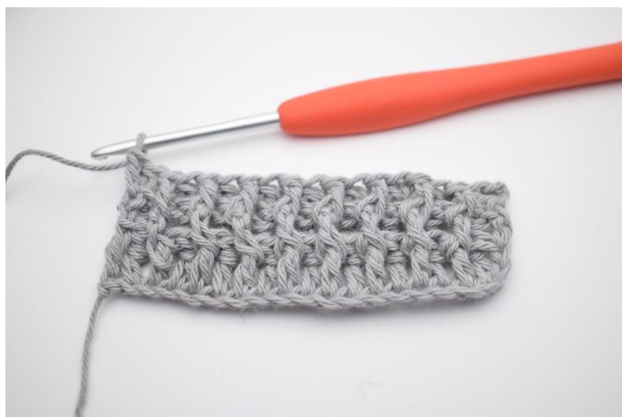
6. Gentag skiftevis rækken ud. I sidste m hækles 1 alm. Stgm.