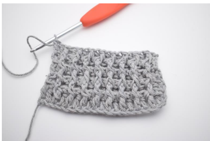
1. Række 5 hækles efter fremgangsmåden som række 3. Sådan gentages rækkerne skiftevis som beskrevet i opskriften.