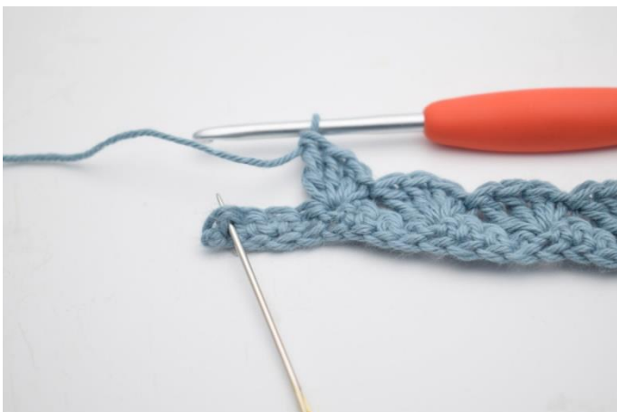
9. I sidste m hækles 1 fm.