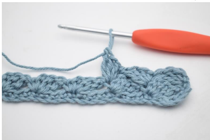
7. og hæk 1 fm, 2 stgm og 1 db-stgm i næste m.