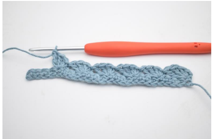
8. Gentag rækken ud.