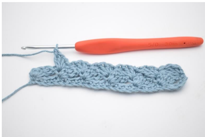
8. Gentag rækken ud.