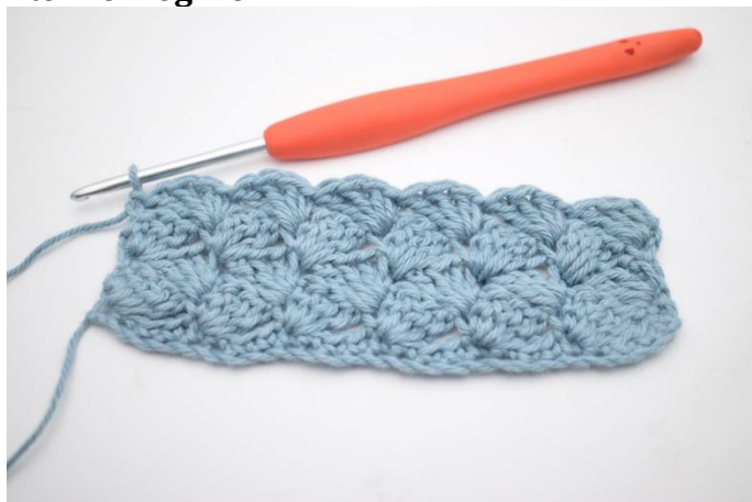
1. Sådan gentages rækken som beskrevet i opskriften.