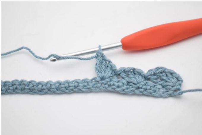
7. Hækl 1 fm, 2 stgm og 1 db-stgm i næste m.