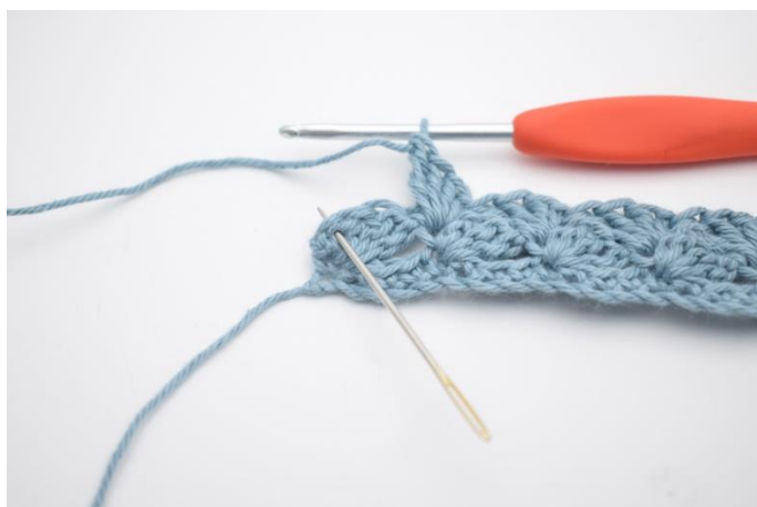
9. I side m hækles 1 fm.