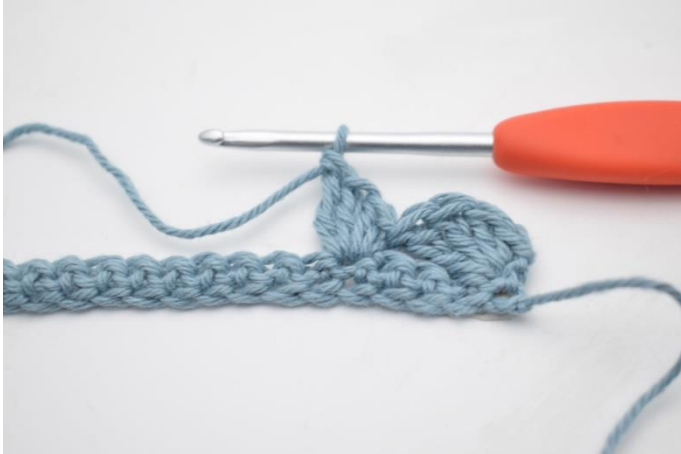
5. Hækl 1 fm, 2 stgm og 1 db-stgm i næste m.