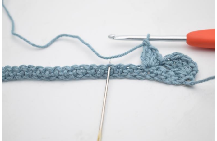
6. Spring 3 m over.