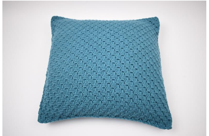
10. Fortsæt til du er hele vejen rundt. Afslut med 1 km. Klip garnet og hæft ender.