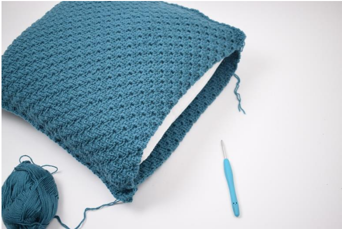
9. Kom puden i inden den lukkes helt til.