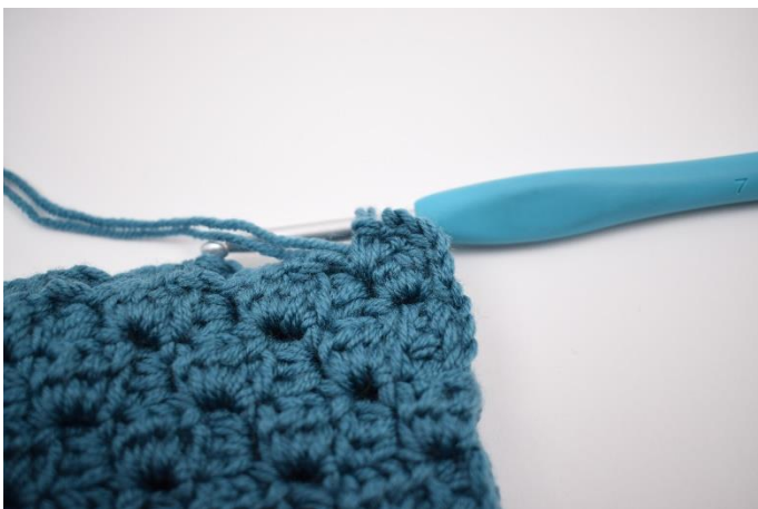
7. Lav 2 lm. Hækl 1 fm imellem de næste 2 "firkanter".