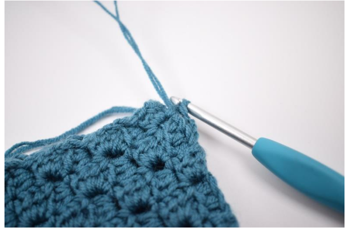
4. Hækl 1 fm imellem de næste 2 "firkanter".