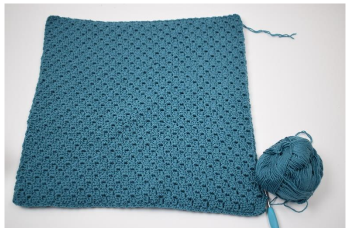
8. Gentag dette rundt om pude.