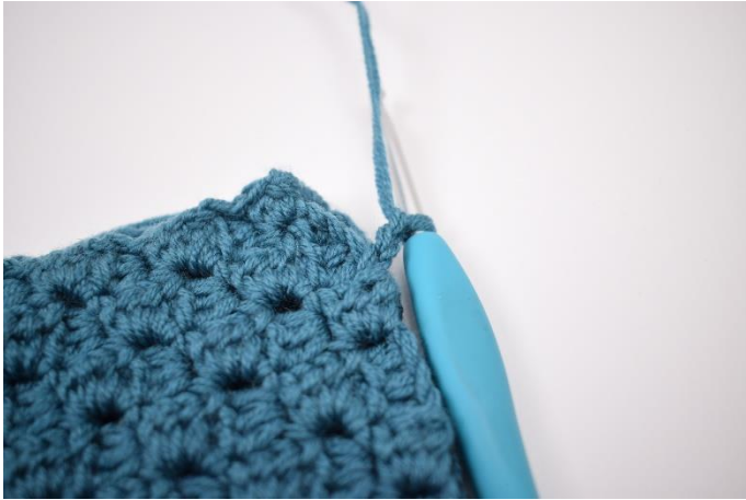
3. Lav 2 lm.