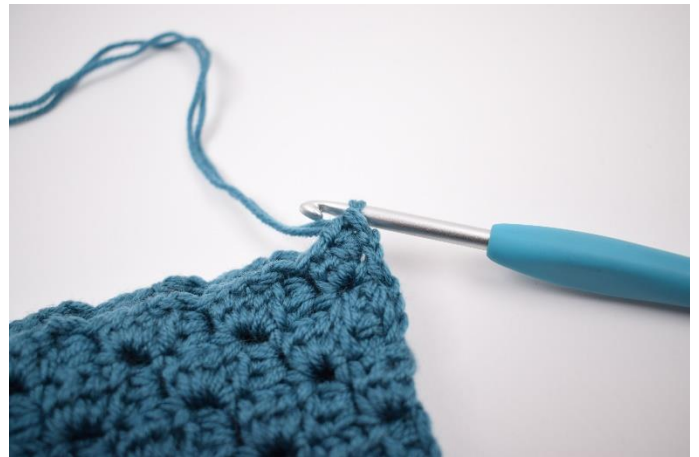
6. Hækl 1 fm i hjørnet.