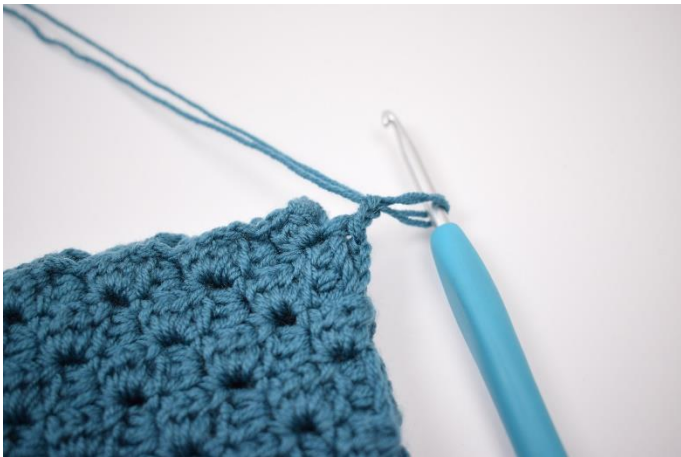
5. Lav 2 lm.