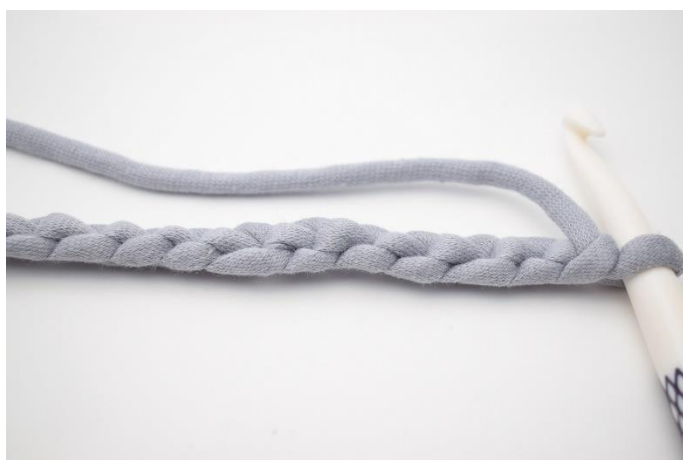
2. Drej din lm-række så "bagsiden" vender opad.