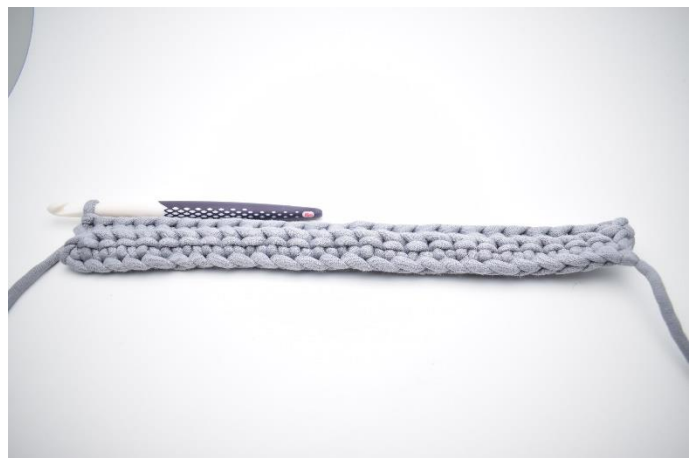
6. Gentag rækken ud.