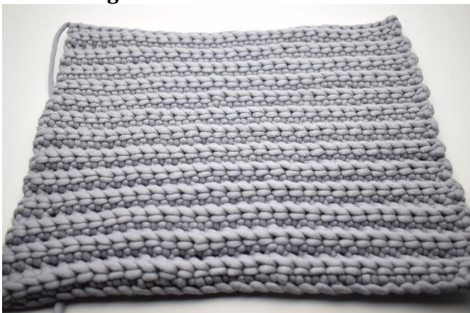
1. Gentag række 2 i alt 25 gange. Klip garnet og hæft ender. Hækl 1 stykke mere magen til.