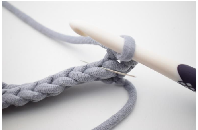
4. Hækl 1 fm i bml i næste m. Nålen her markerer den lænke din fm skal hækles i.