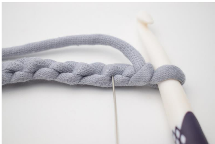
3. For at få en pænere kant kan man med fordel hækle fm i de vandrette lænker. Nålen her markerer den lænke din første fm skal hækles i.