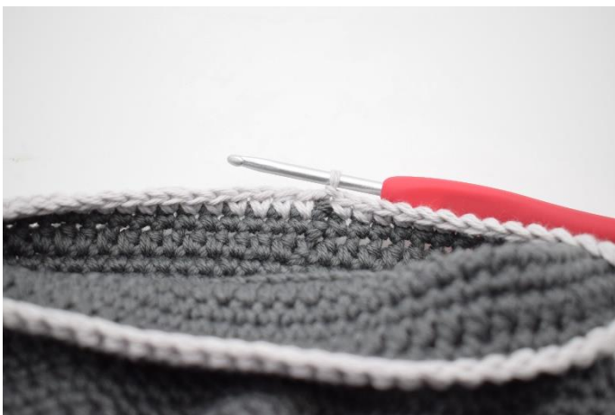
13. Hækl kant/fold som beskrevet i opskriften. Skift til en kontrastfarve. Lav 1 lm og hækl fm omgangen rundt. Afslut med 1 km. Klip garnet og hæft ender.