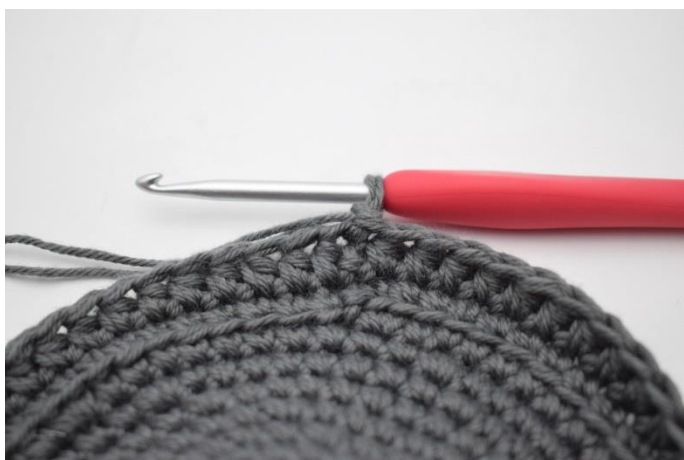
7. Lav 1 lm.