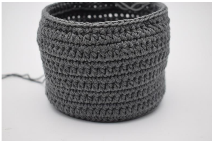
9. Gentag disse 2 omgange som beskrevet i opskriften.