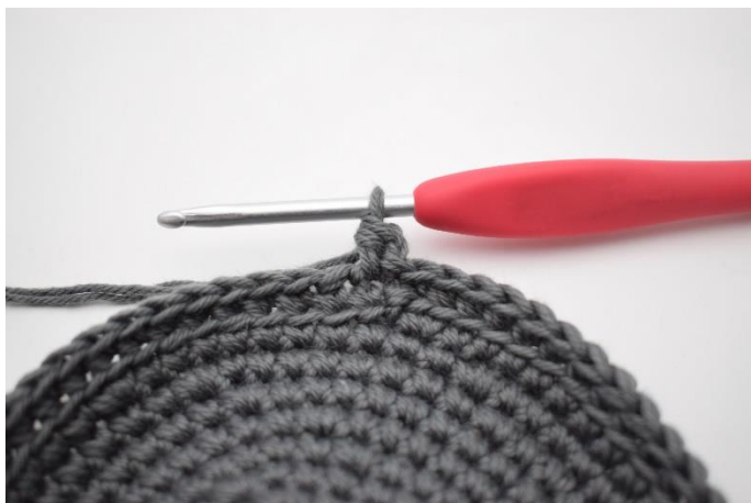
5. Hækl 1 hstm.