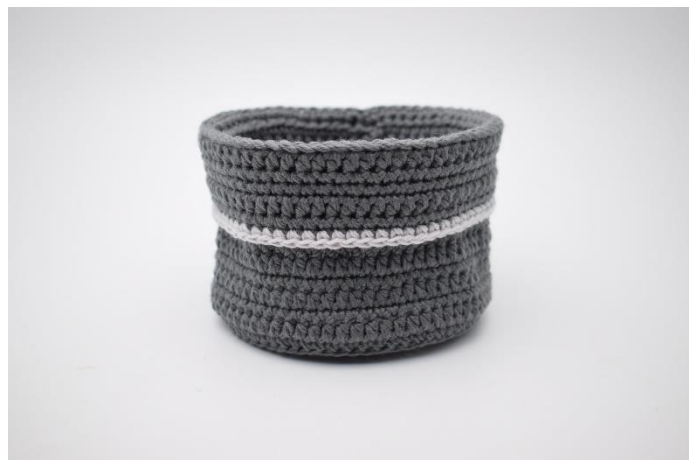
14. Fold nu kanten ned over kurven.