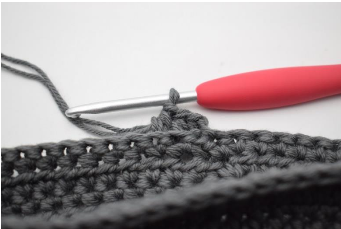
11. Lav 1 lm, og hækl hstm i bml omgangen rundt.