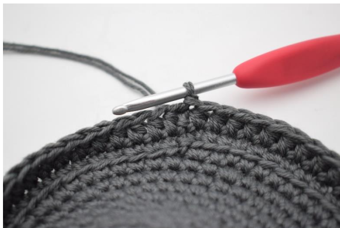
6. Hækl hstm omgangen rundt og afslut med 1 km.