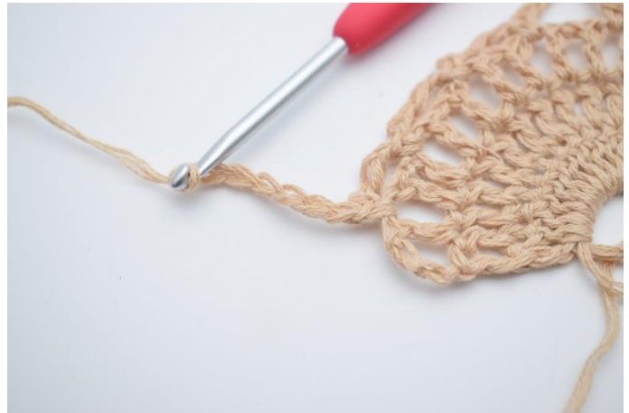
14. Lav 7 lm.