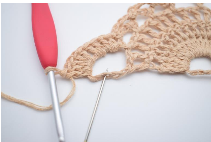
13. Hæk 10 stgm i den sidste store lm-bue. Den sidste stgm hækles i 3. lm som nålen her markerer.