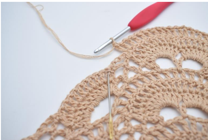
53. Spring den lille lm-bue over, og hæk 1 stgm i den første stgm omkring den næste store lm-bue. Nålen her markerer hvor din næste stgm skal hækles.