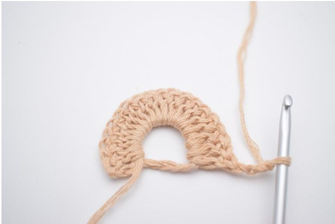
1. Lav 3 lm (erstatte 1. stgm).