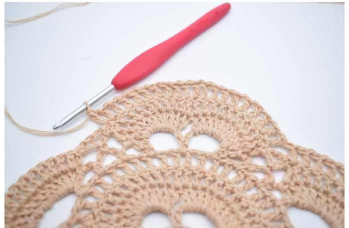
Hækl "1 lm, 1 stgm" i alle masker rundt om de 2 store lm-buer. (20 stgm)