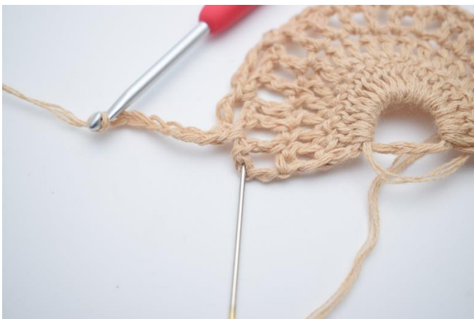
15. Hækl 1 stgm i sidste m. Nålen her markerer hvor din stgm skal hækles.