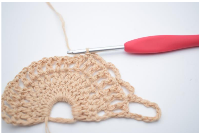
7. Gentag 1 gang mere så du har 3 små lm-buer.