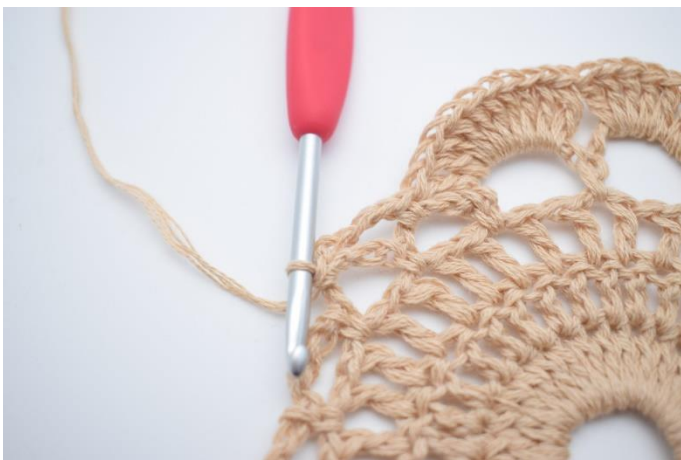
11. Lav 4 lm, og hæk 1 fm i næste lm-bue.