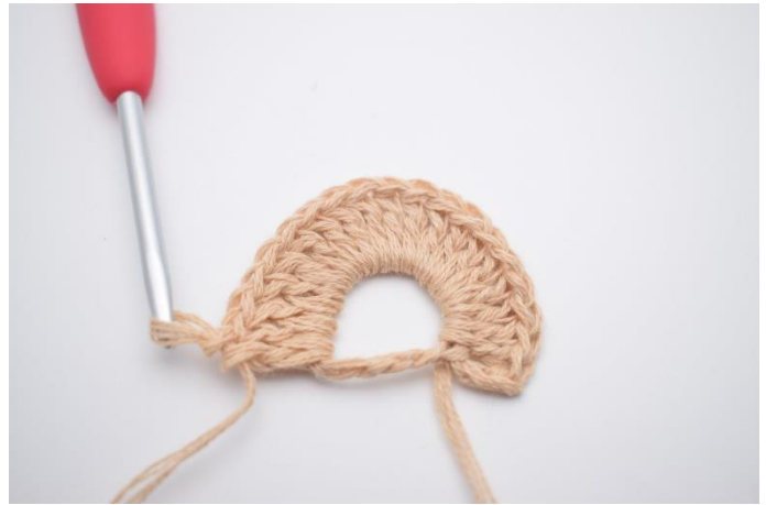
2. Hækl 19 stgm i lm-ringen. (20 stgm)