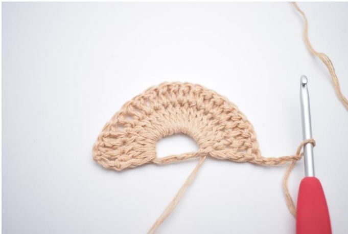
1. Vend dit arbejde med 4 lm (erstatte 1 stgm og 1 lm).