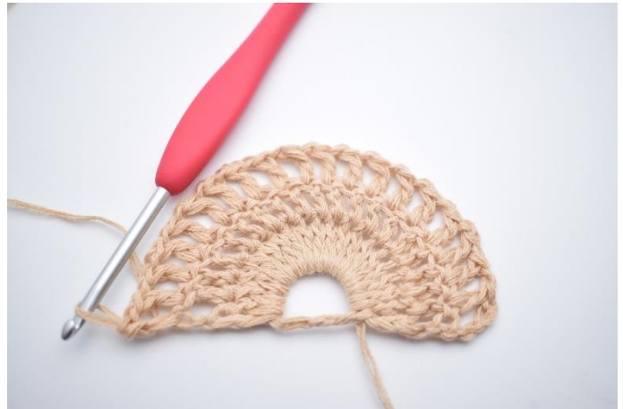
2. Hækl 1 stgm i næste m. Hækl "1 lm, 1 stgm" i alle masker rundt. (20 stgm)