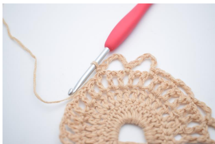
10. Lav 7 lm, spring 1 lm-mellemrum over og hækl 1 fm i næste lm-mellemrum.