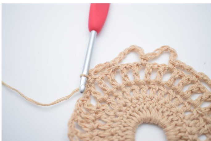
11. Lav 4 lm, spring 1 lm-mellemrum over og hækl 1 fm i næste lm-mellemrum.