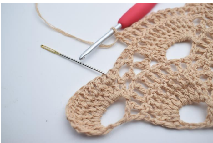
55. Spring den lille lm-bue over, og hæk 1