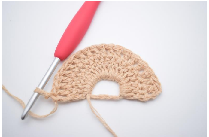
2. Hækl 1 stgm i alle masker rundt. (20 stgm)