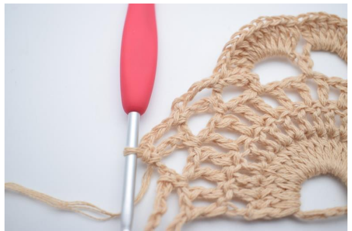
12. Lav 4 lm, og hæk 1 fm i næste lm-bue.