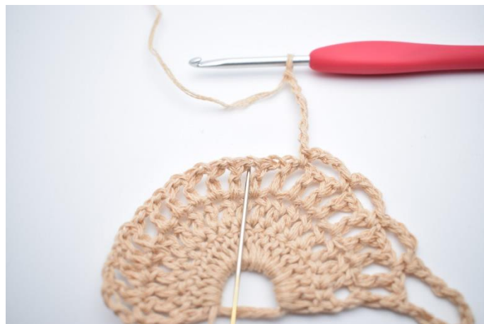
8. Lav 7 lm, spring 1 lm-mellemrum over og hækl 1 fm i næste lm-mellemrum.