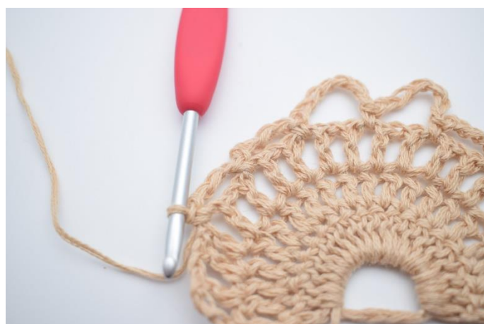
12. Lav 4 lm, spring 1 lm-mellemrum over og hækl 1 fm i næste lm-mellemrum.