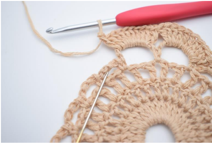
9. Lav 1 fm i lm-buen ved siden af. Nålen her markerer hvor din fm skal hækles.