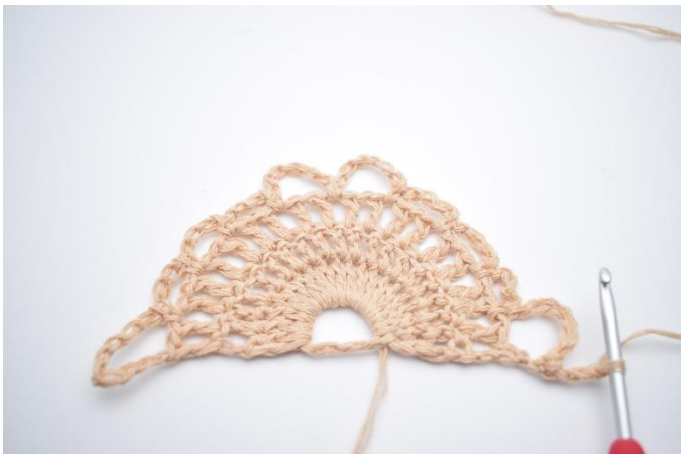
1. Vend dit arbejde med 3 lm (erstatte 1. stgm).