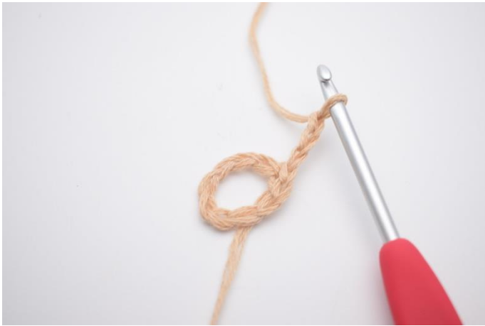
1. Lav 3 lm. (de erstatter 1. stgm)