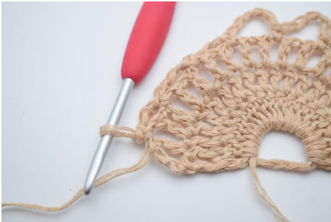
13. Gentag 1 gang mere så du har 3 små lm-buerne med 4 lm.