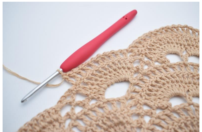
54. Hækl "1 lm, 1 stgm" i alle stgm omkring den store lm-bue. (10 stgm)