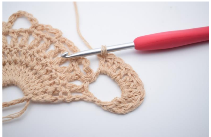
2. Hækl 9 stgm i lm-buen (10 stgm).