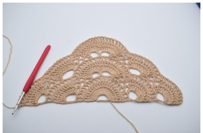
56. Hækl "1 lm, 1 stgm" i alle stgm omkring