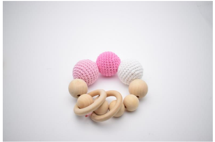
8. og bind nu snoren godt.