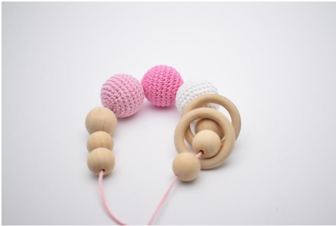
7. Sæt træringene på,