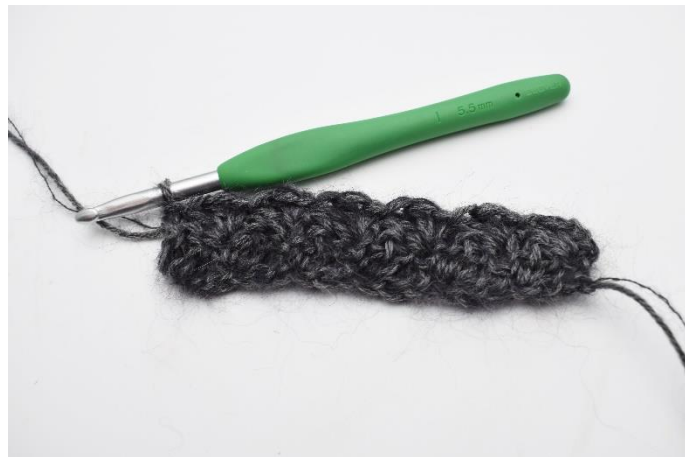
10. hækles 1 fm.