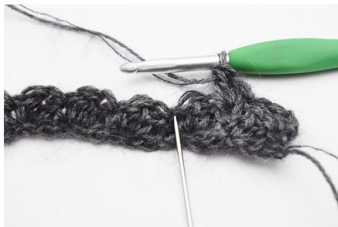
6. Spring 2 masker over,