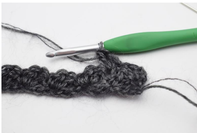
5. hækl "1 fm, 2 stgm i næste m".