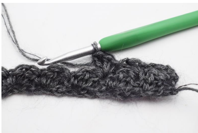
7. hækl "1 fm, 2 stgm i næste m".