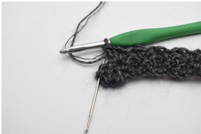
9. I vendemasken, (nålen her markerer din vendemaske fra forrige række)