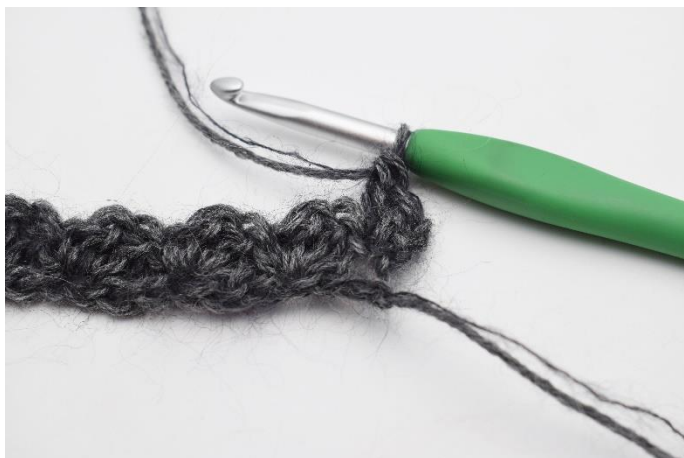
3. hækles 2 stgm.