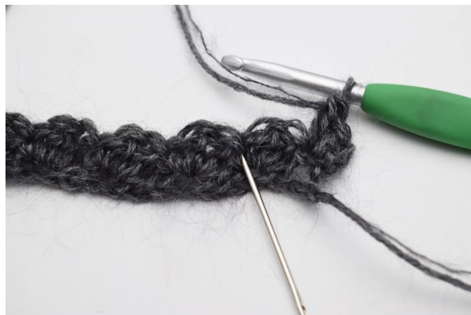
4. "Spring 2 masker over,