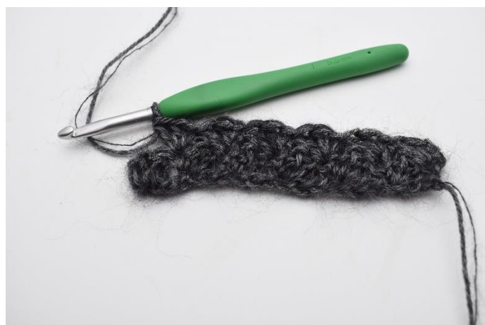
8. "Spring 2 masker over, hækl 1 fm, 2 stgm i næste" Gentag "til" rækken ud.