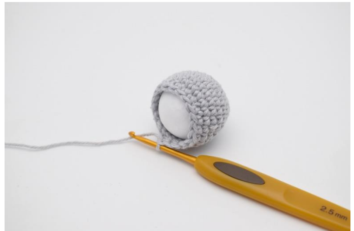
2. sættes kuglen i.