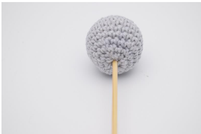
5. Sæt blomsterpinden/spyddet i kuglen