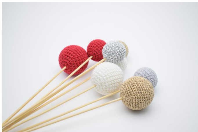
6. De er nu klar til at dekorere dit hjem ☺