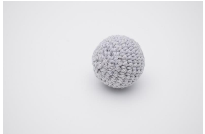
4. Sy hullet sammen, og hæft enden.