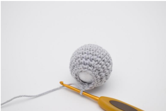
3. Der hækles nu videre omkring den.