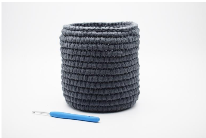
17. Afslut med 1 omgang km.