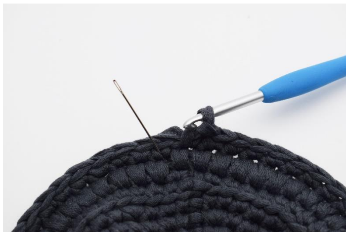
14. Nu hækles der igen 1 omgang dfm. Nålen her markere hvor din næste maske skal hækles.