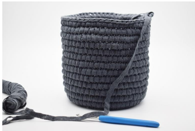
16. Gentag skiftevis omgangene med fm, og dfm til du har i alt 13 omgange med dfm, eller til du har den ønskede højde på din skjuler.