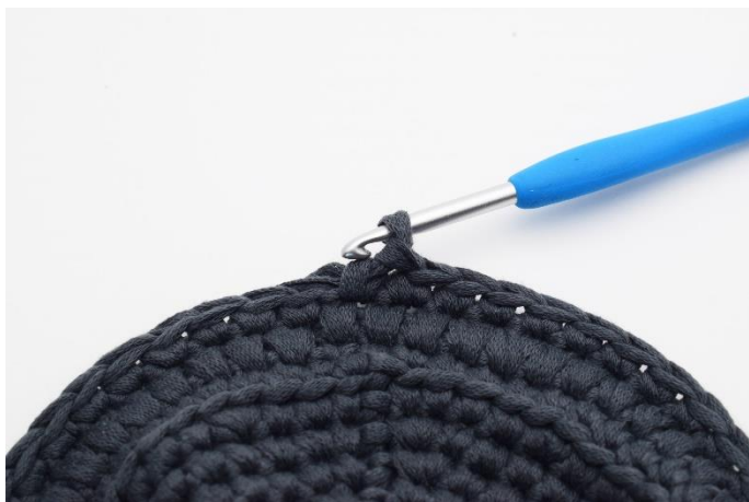
13. Hækl 1 omgang fm som normalt.