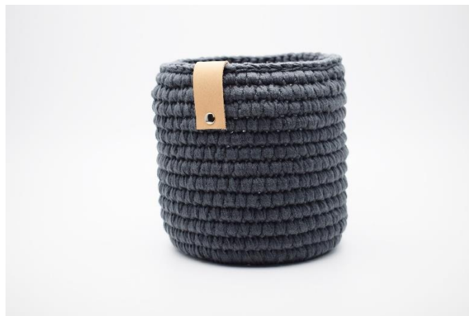
2. Sæt læderremmen ned over kanten, og monter med 1 nitte.