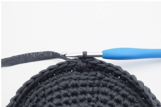
9. Sådan. Der er nu hæklet 1 dfm.