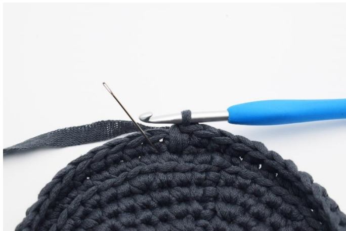
10. Nålen her markere hvor din næste dfm skal hækles.