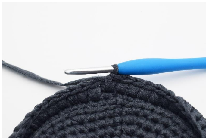
12. Gentag omgangen rundt.