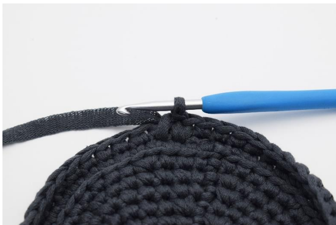
11. Sådan. Der er nu hæklet endnu 1 dfm.