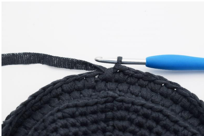
15. Gentag omgangen rundt.