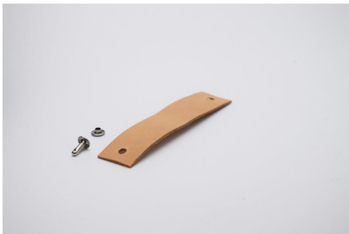
1. Klip din læderrem i den ønskede størrelse, og lav 1 hul i begge ender.