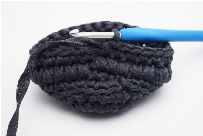
5. Hækl 1 omgang med fm som normalt.