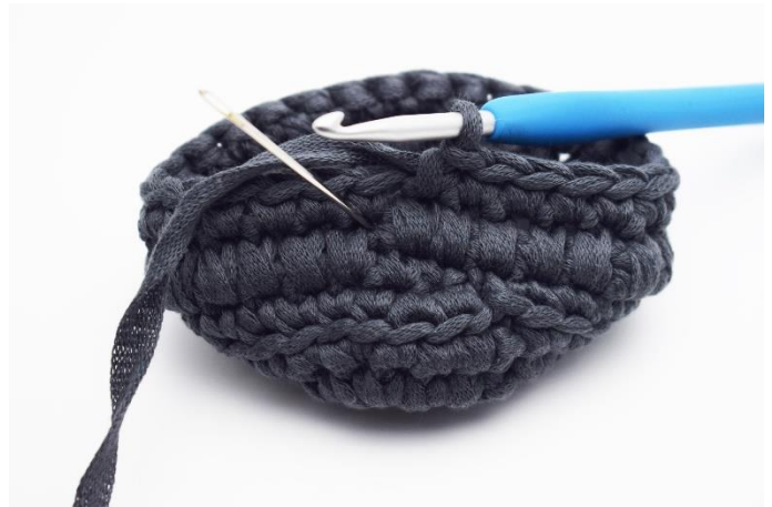
6. Nu hækles der igen en omgang med dfm. Nålen her markere hvor din næste dfm skal hækles.