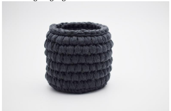
10. Afslut med 1 omgang km.