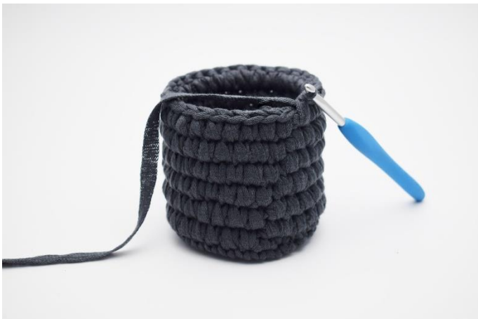
9. Gentag skiftevis omgangene til du har i alt 6 omgange med dfm.