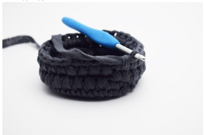
8. Gentag omgangen rundt.