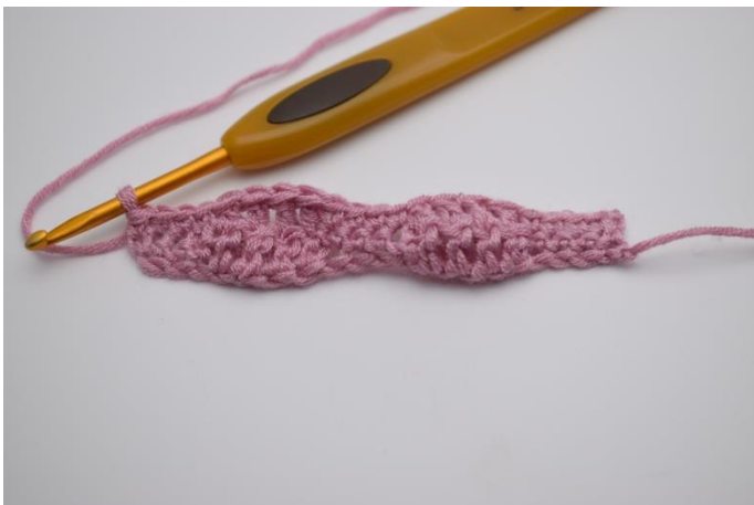
9. Hækl "1 fm i de næste 4 masker, 1 stgm i de efterfølgende 4 masker". Gentag "til" rækken ud, og afslut med 1 fm i de sidste 4 masker.