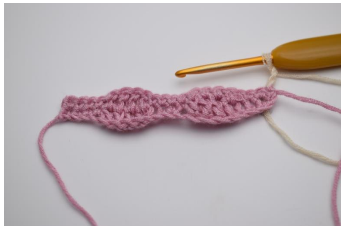
10. Skift til farve 2. Lav 3 lm. De erstatter 1.stgm.