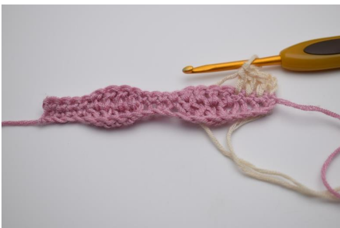
11. Hækl 1 stgm i de næste 3 masker.