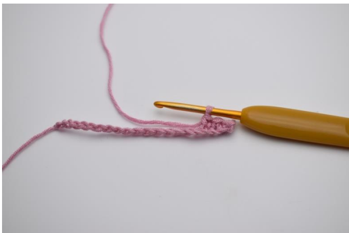
3. Hækl 1 fm i de næste 3 lm.