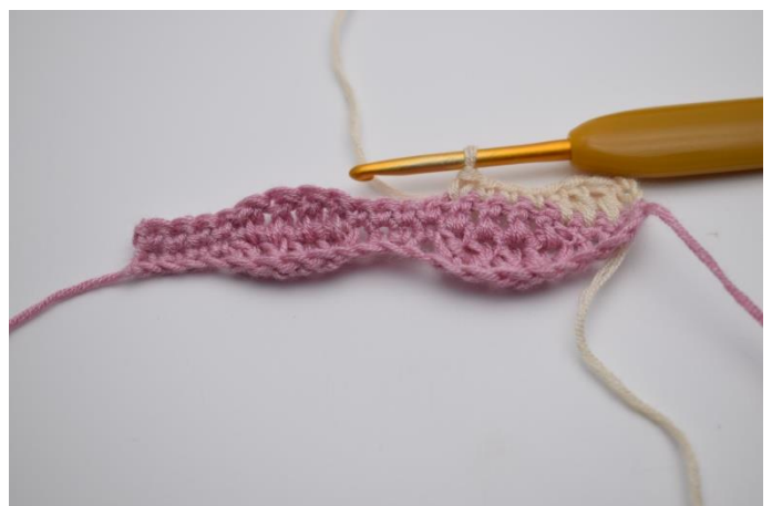
12. Hækl 1 fm i de efterfølgende 4 masker.