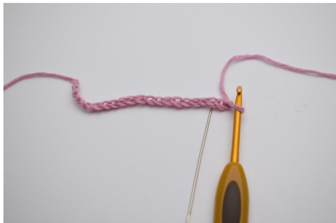
2. Spring de 2 første lm over, så du hækler din første maske i 3.lm fra nålen.