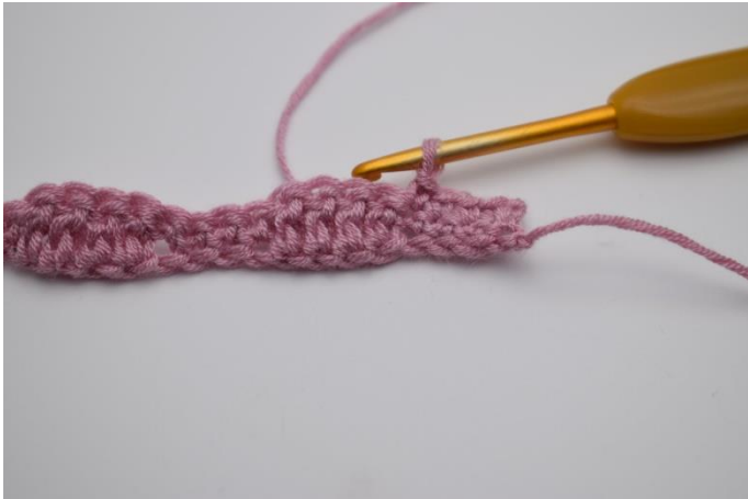
7. Hækl 1 fm i de næste 4 masker.