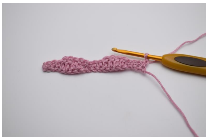
6. Vend dit arbejde med 1 lm.