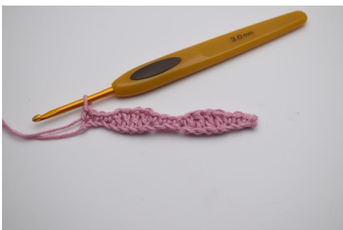
5. Hækl "1 fm i de næste 4 lm, 1 stgm i de efterfølgende 4 lm". Gentag "til" rækken ud, og afslut med 1 fm i de sidste 4 masker.