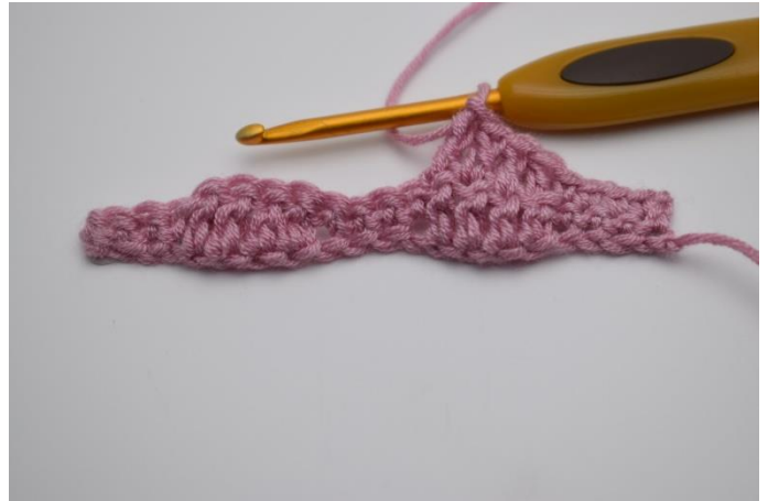
8. Hækl 1 stgm i de næste 4 masker.