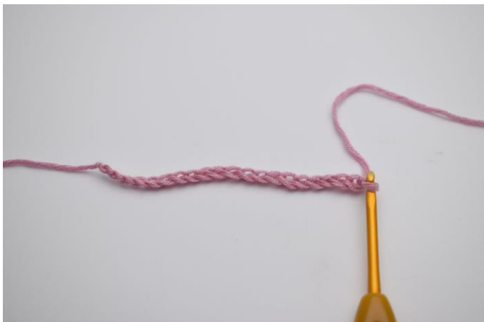
1. Start med at slå din luftmaskerække op.