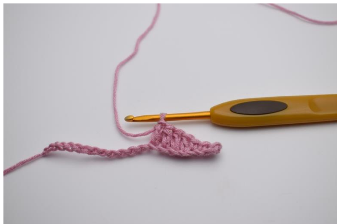
4. Hækl 1 stgm i de næste 4 lm.