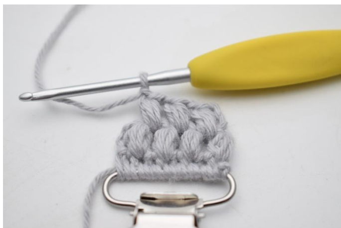
15. Gentag imellem de næste puf masker.