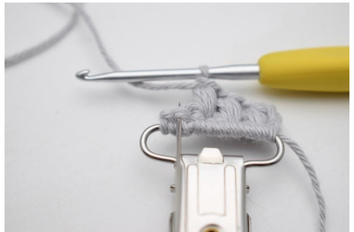
10. Spring 1 m over og hækl 1 puf maske i næste m.