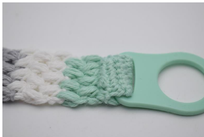
Sy adapteren fast. Klip garnet og hæft ender.