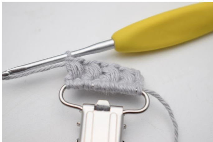
11. Sådan. Du har nu 4 puf masker.