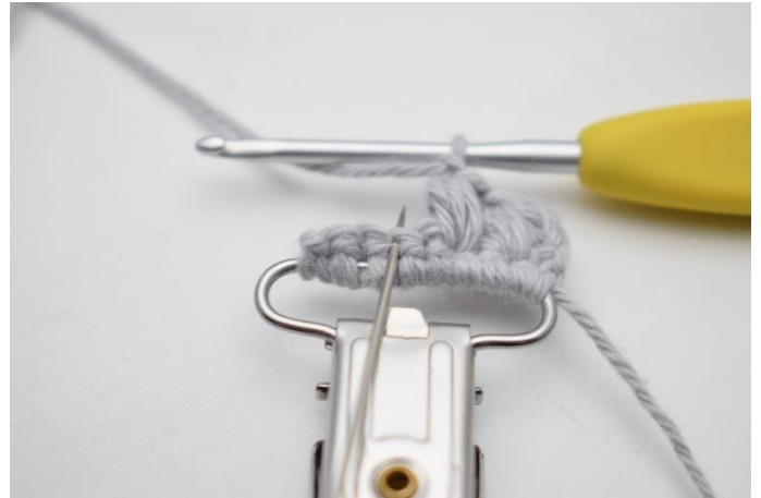
8. Spring 1 m over og hækl 1 puf maske i næste m.