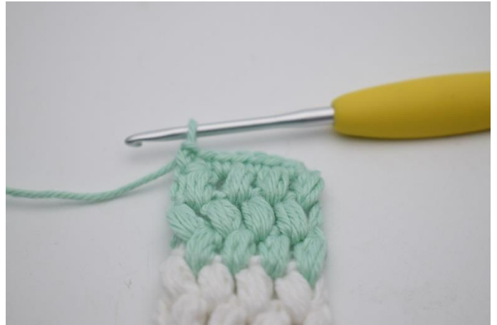
20. Vend med 1 lm, hækl fm rækken ud.