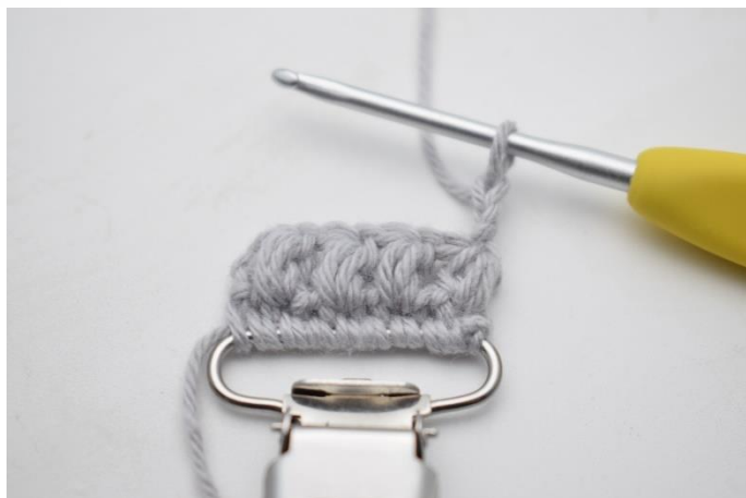
12. Vend med 2 lm.