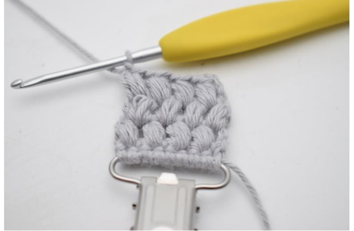
18. Gentag til du har 3 rækker med puf masker med fv. A.