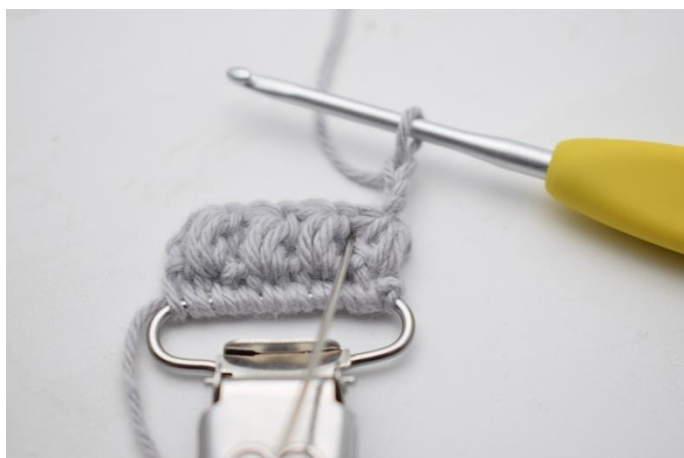
13. Hækl 1 puf maske imellem 2 puf masker på forrige række. Nålen her markerer hvor din puf maske skal hækles.