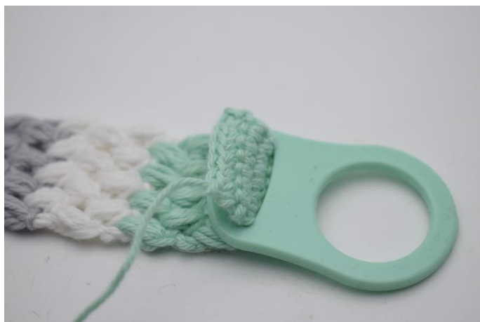
Kom enden af suttesnoeren igennem sprækken på adapteren.

Gentag så du har i alt 4 rækker med fm. Klip garnet og efterlad en lang snor til montering,