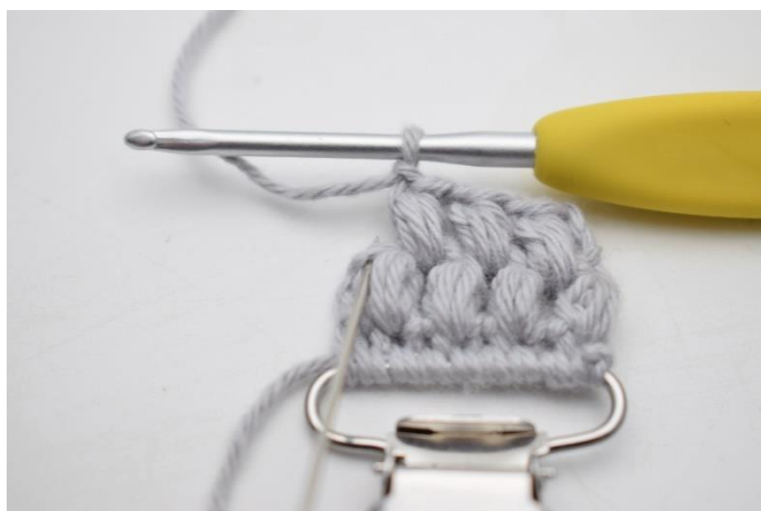
16. Sidste puf maske hækles imellem sidste puf maske og vendemasken på forrige række. Nålen her markerer hvor din sidste puf maske skal hækles.