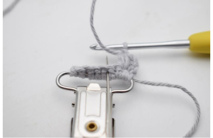
6. Spring 1 m over og hækl 1 puf maske i næste m.