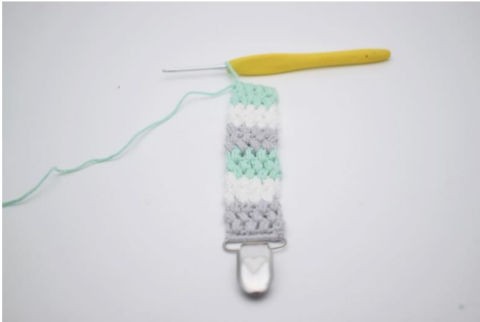
19. Gentag rækken med farveskift som beskrevet i opskriften.