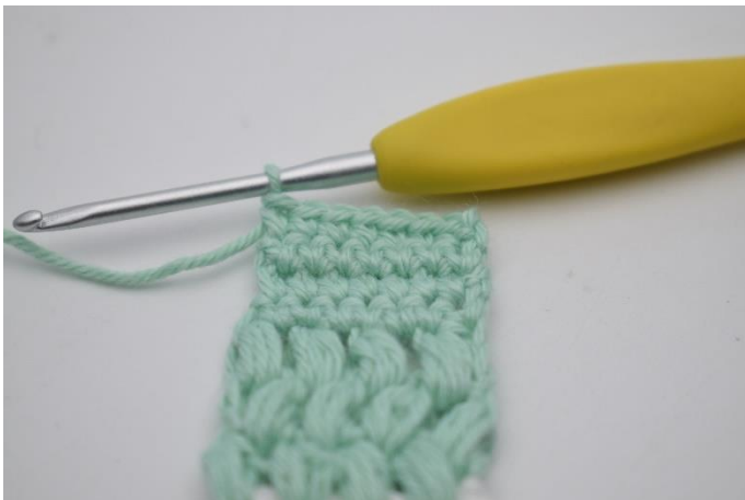
21. Gentag til du har 4 rækker fm. Klip garnet og efterlad en lang snor til montering.