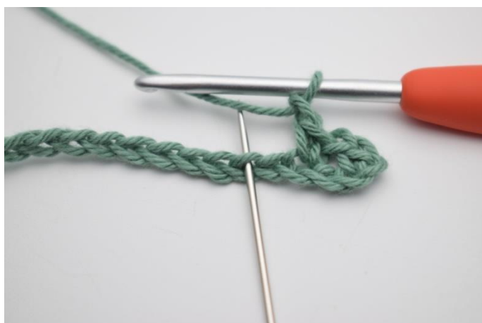
7. Lav 1 lm, spring 1 lm over og hækl 1 fm i næste m.