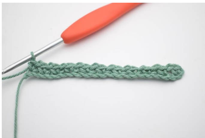
9. Gentag rækken ud.