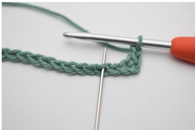
5. spring 1 lm over og hækl 1 fm i næste m.