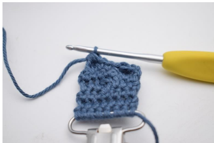
14. Hækl 1 boble maske i næste m.