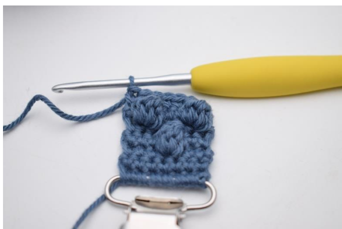
17. Hækl fm rækken ud.