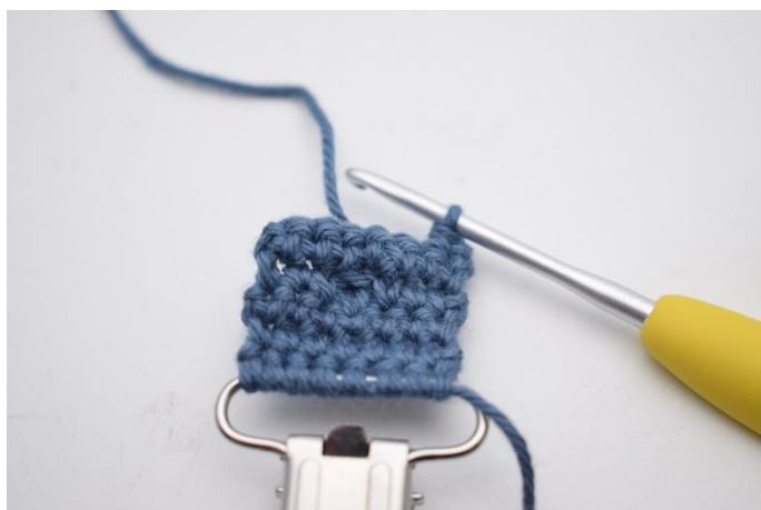
11. Hækl 1 fm i første m.