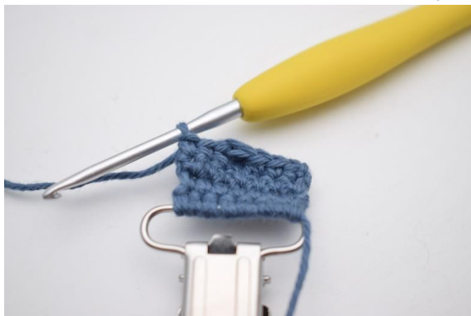
7. Hækl 1 fm i de sidste 3 m.