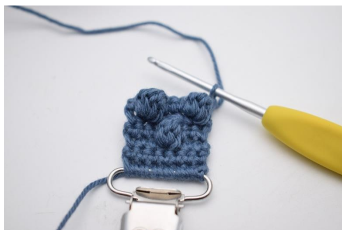
16. Vend dit arbejde med 1 lm.