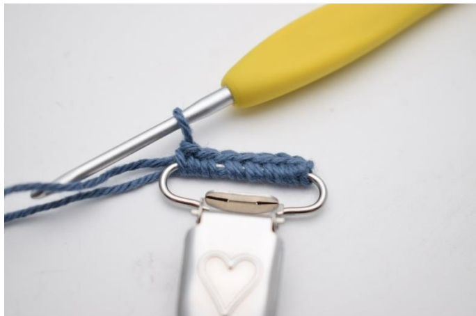
2. Hækl 7 fm.