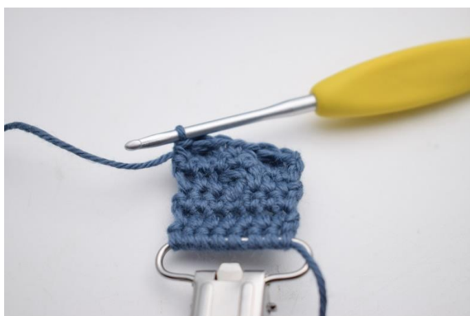
15. Hækl 1 fm i sidste m.