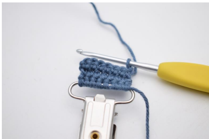
4. Vend arbejdet med 1 lm.