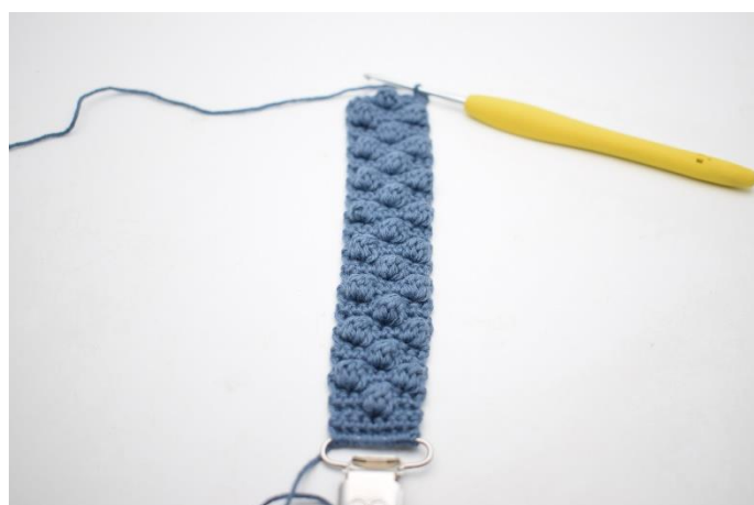
18. Gentag nu rækkerne med bobler som beskrevet i opskriften.