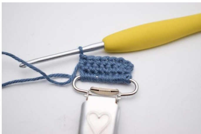
3. Vend med 1 lm, og hækl fm rækken ud. Gentag så du har 2 rækker med fm.