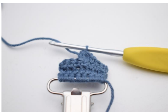
6. Hækl 1 boble maske i næste m.