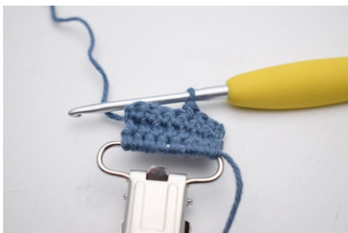
5. Hækl 1 fm i de første 3 m.