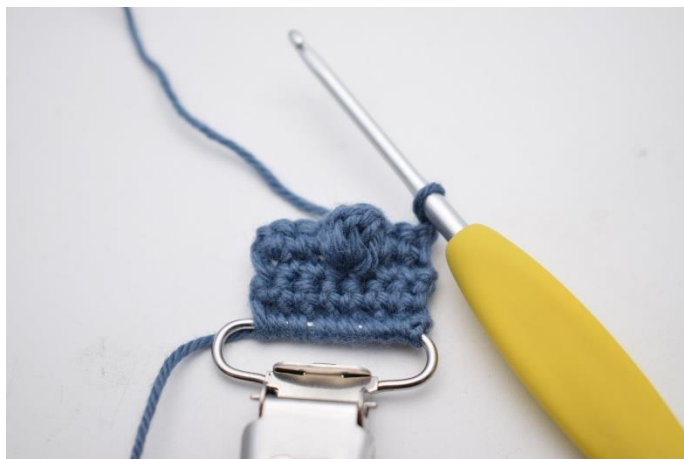
8. Vend dit arbejde med 1 lm.