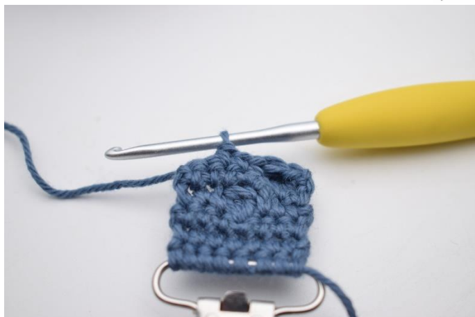
13. Hækl 1 fm i de næste 3 m.