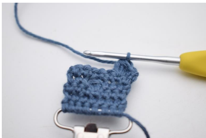
12. Hækl 1 boble maske i næste m.