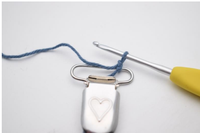
1. Lav en løkke omkring clipsen.