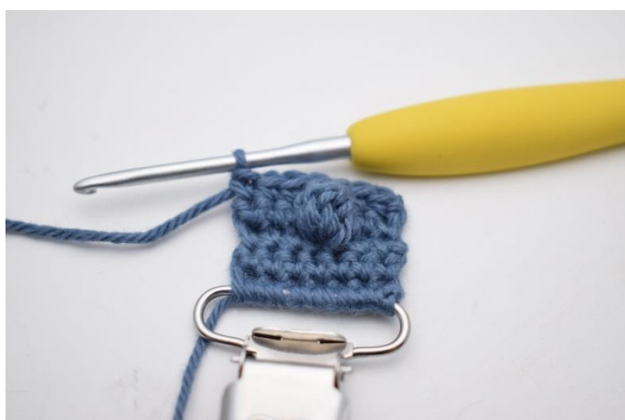
9. Hækl fm rækken ud.